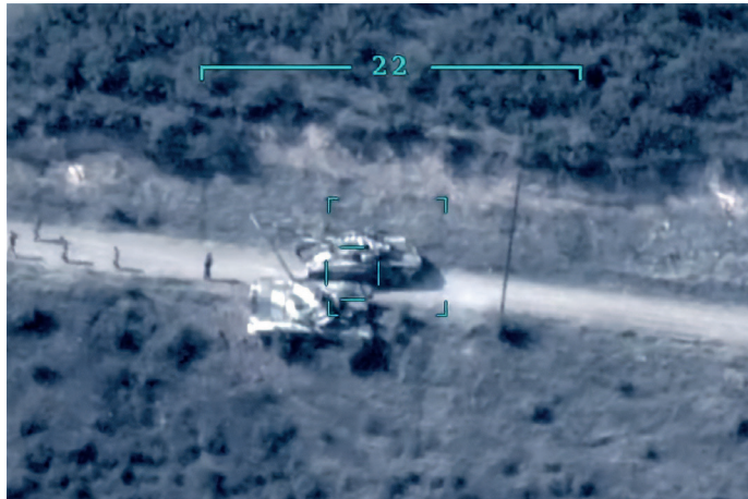
5. ábra Egy örmény harckocsi egy azeri drón optikáján keresztül [6]

A konfliktus gyökerei a 20. század elejére nyúlnak vissza, bár a jelenlegi konfliktus 1988-ban kezdődött, amikor a karabahi örmények azt követelték, hogy Karabahot adják át a szovjet Azerbajdzsán fennhatósága alól Szovjet-Örményországnak. A konfliktus az 1990-es évek elején teljes körű háborúvá fajult, amely 1994-ben tűzszüneti megállapodással ért véget, de a konfliktus soha nem oldódott meg. Az Azerbajdzsán és Örményország közötti területi vita véres fellángolása azzal a kockázattal jár, hogy regionális háborúvá fajulhat. A folyamatban lévő harcok 2020. szeptember 27-én bontakoztak ki. A térségben történt határ menti összecsapások voltak a legsúlyosabbak a két ország történelmében. A felek Hegyi-Karabahért harcolnak, amely egy Azerbajdzsánon belül fekvő hegyvidéki régió és annak néhány közeli területe. Baku szuverenitást követel a szovjet időkben meghatározott határok alapján, és azt állította, hogy ezeket a területeket megszállta Örményország. Ennek a konfliktusnak minden körülménye többnyire ugyanaz, mint korábban volt, de egy óriási különbség mégiscsak van. Az azeri erőket Törökország nagymértékben támogatja modern katonai eszközökkel, felszerelésekkel, köztük a legújabb török fejlesztésű fegyveres drónokkal. A másik oldalon pedig az örmény csapatok a volt szovjet időszak katonai eszközeivel vannak felszerelve. Például a régi szovjet légvédelmi ágyúknak nincs esélyük a török drónok ellen, mivel elavultak, nem képesek bemérni és elpusztítani azokat.