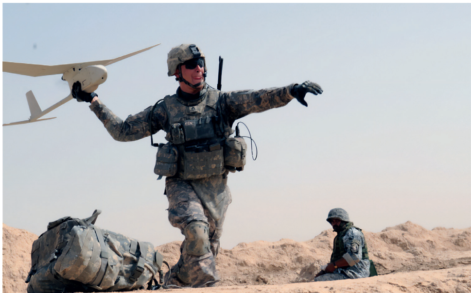
3. ábra RQ-11 Raven indítása [42]

A következő típus a 4. ábrán, indítás előtti munkálatok közben látható RQ-7 Shadow, amely az operátoroktól akár 125 km-re lévő célok felkutatására, felismerésére és azonosítására is képes. A rendszer nappal és éjszaka is felismeri a harcászati járműveket 2,5 km magasságból és 3,5 km-es ferde távolságból. A képi és telemetriai adatokat közel valós időben továbbítja a földi irányítóállomásra, az összes forrást elemző rendszerhez és akár a tüzérség célzási és irányítási rendszeréhez. A Shadow-t aktívan alkalmazták Afganisztánban és Irakban, valamint kiképzési célokra az Amerikai Egyesült Államokban is. Az egyetlen olyan méretű pilóta nélküli repülőgéprendszer lett, amely 2016 júniusában átlépte az egymillió teljes repült órát. A Shadow pilóta nélküli repülőgéprendszer-családot az AAI marylandi Hunt Valley-ben található létesítményeiben gyártják [15]. Az egymillió repült óra alatt jelentős mennyiségű tapasztalatot gyűjtöttek a drónnal kapcsolatban, ez idő alatt a megbízhatósági problémái révén 271 balesetet szenvedett, bár ezek közül csak egy volt A osztályú. 6