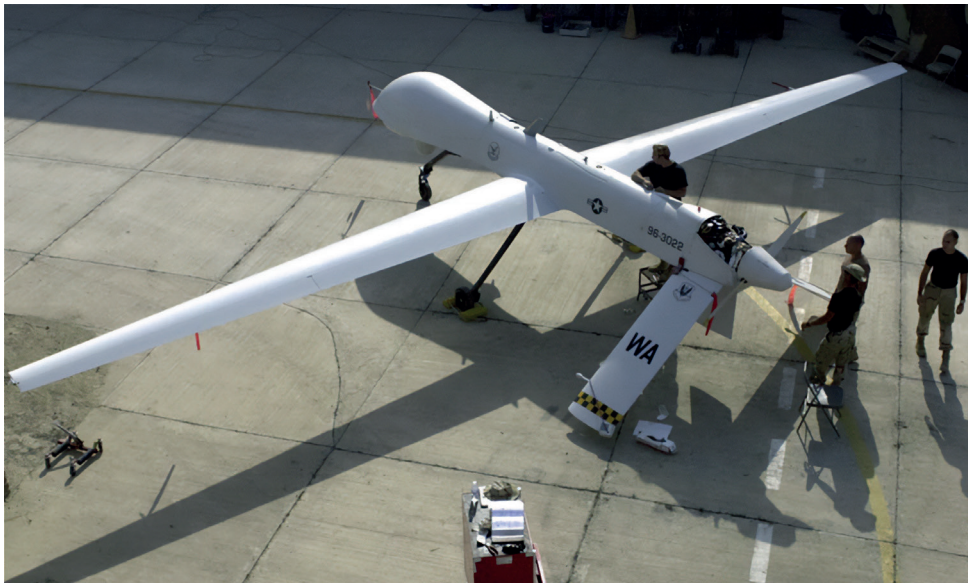
2. ábra RQ-1 Predator [5]

Az új típus pedig nem volt más, mint a 2. ábrán bemutatott RQ-1 Predator. 4 Az amerikai légierő 11. légi felderítő parancsnokságának Predator-századát 1995 nyaratól a Jugoszlávia területén zajló háború idején vetették be. A következő évben a Kongresszus drasztikusan megemelte a Predatorok beszerzésének költségvetését, 50 millió dollárról 115,8 millió dollárra, mivel a felhasználási tapasztalatok nagyon jó eredményeket mutattak, amiből kirajzolódott, hogy a 21. század modern hadviselésében jelentős szerepet fognak betölteni a drónok. Akkoriban áttörésnek számított már az is, hogy valós idejű felderítést tudtak végrehajtani, ami azt jelenti, hogy az optikai rendszerek által rögzített képet és mozgóképet azonnal továbbították az operátorok felé egy olyan repülőről, amelynek a fedélzetén nem tartózkodott hajózó. A Predatorok használatának első évében számos sikeres bevetést hajtottak végre. Az RQ-1 első, fegyvertelen, hírszerző, megfigyelő és felderítő változata 1995 júliusában települt Albánia területére. Ugyanebben a hónapban a légierő létrehozta a fentebb már említett 11. Légi Felderítő Századot a nevadai Indian Springs Air Force Auxiliary Field-en, mint a légiharc-parancsnokság első Predator-egységét. A 11. Légi Felderítő Század 1996 őszére átköltözött országunk taszári bázisára, és innen végezték az RQ-1-esek üzemeltetési feladatait és irányításukat.