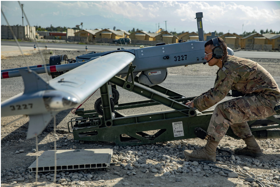
4. ábra RQ-7 Shadow [39]

verzióit, a V1-est, egy újabb verzióra, a V2-esre cseréli, amely korszerűsített hajtóművel és hosszabb szárnyfesztávolsággal rendelkezik. A fejlesztések további három órával hosszabb repülési időt biztosítanak a repülőgépeknek. A V2-eseken emellett digitális berendezések vannak, ami lehetővé teszi a Tactical Common Data Link integrálását. A TCDL segítségével a Shadow kommunikálni tud és irányítható egy pilóta által irányított helikopterből, erre példa az AH-64, lehetővé téve, hogy a helikopter pilótája képes legyen irányítani a drónt, és ennek köszönhetően alacsonyabb észlelhetőség mellett felderíteni egy adott terepet, és csak a felderítés után berepülni oda csapásmérésre [18], [33].