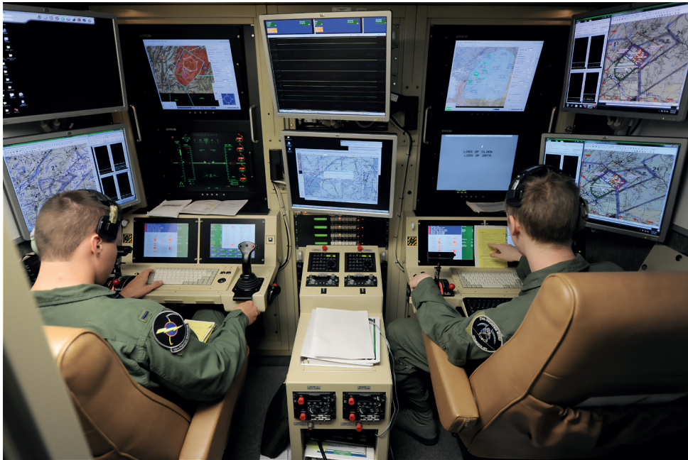
8. ábra Egy MQ-9 drón pilótafülkéje [1]

Az amerikai légierő egyik felmérése szerint az ilyen jellegű munkát végzők közül majdnem minden ötödik volt szemtanúja például nemi erőszaknak, egyesek közülük több mint 100 nemi erőszaknak vagy kínzásnak egy éves ciklusban. Ezek az operátorok nem tudnak csak úgy félrenézni, elfordítani a tekintetüket az erőszak láttán, hiszen a munkájuk miatt nem is szabad. Ők támogatják és segítik az amerikai szárazföldi csapatok és szövetségeik védelmét a levegőből azáltal, hogy figyelik a fenyegetéseket és irányítják a repülő drónokat. A távoli hadviselés azért is egyedülálló, mert az operátoroknak hosszú műszakokat kell végigülniük, gyakran éjszakánként, majd miután vége, gyorsan át kell váltaniuk a munka és a hétköznapi élet között. Ez, lássuk be, nem egyszerű. Sok esetben olyan lehet, mintha a missziós katona minden egyes bevetés után hazatérne a családjához, majd vissza a terepre. Ahogy teltek az évek, tisztán kirajzolódott, hogy a drónpilóták kiegészi aránya valójában magasabb, mint a hagyományos pilótáké. Egy korai elképzelés szerint ezek a pilóták valamilyen poszttraumás stresszbetegségben szenvednek. Ahogy azonban egyre több pilóta szenvedett ettől, a szakemberek kissé megváltoztatták az álláspontjukat. A PTSD 8 helyett azt állították, hogy ezek a pilóták az úgynevezett „mesterlövész szindrómában” 9 szenvednek. A mesterlövész szindróma esetén a katona érzelmileg szenved