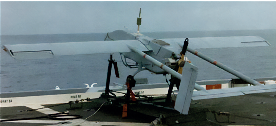
1. ábra Pioneer RQ-2A [7]

A hadsereg is bevetett egy UAV-szakaszt, hogy a hadsereg tüzéségét segítse a tengerészgyalogság drónegységeihez hasonló módon. A Pioneerekhez tartozik egy népszerű történet, miszerint a Wisconsin csatahajó legénysége a 159-es számú Pioneert indította bevetésre, hogy a Missouri 41 cm-es ágyúinak csapása után harcikár-felmérést végezzen. Ahogy a kezelők alacsonyan repültek a Pioneerrel a Failaka-sziget fölött, számos iraki harcos arra gondolt, hogy a csatahajó valószínűleg újabb sortűzre készül. Amikor az UAV elhaladt közvetlen felettük,