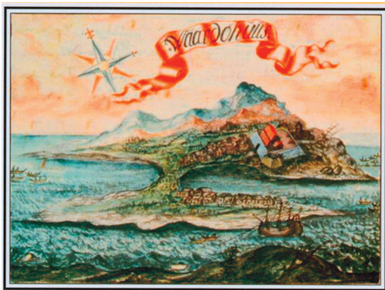
2. ábra Waardöhuus (Vardø) egyik korai látképe [6]

A Vénusz Nap előtti átvonulásának óriási jelentősége volt, hiszen egyértelműen igazolta az ókori tudós, a Szamosz szigetén élő Arisztarkhosz, majd több mint 1500 év múlva Kopernikusz, Kepler és végső soron Newton állításait, az egyetemes tömegvonzás törvényét. A két csillagász megfigyelése egyértelművé tette, hogy a bolygók nem a Föld, hanem a Nap körül keringenek [7]. Hell Miksának jelentős szerepe volt három magyarországi csillagvizsgáló megalapításában (Eger, Egri csillagda 1776; Buda, Budai Csillagvizsgáló 1780; Gyulafehérvár, Batthyáneum 1794). Csillagászati munkásságának elismeréseként nevét ma egy kráter is őrzi a Holdon, továbbá róla nevezték el a 3727 Maxhell kisbolygót [8].