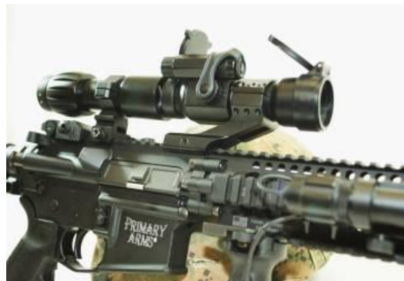
1. kép Fegyverre szerelt lézeres célmutató (Red dot) [7]

A kisteljesítményű lézerek a haditechnikai alkalmazásokban elsősorban fegyver céljelölőként, távmérőkben és pl. önirányító fejes harceszközök célmegjelölő eszközeként alkalmazzák. A lövészfegyverekre szerelt célmutató arra szolgál, hogy nagy dinamikájú akciókban, amikor nincs mód a fegyverre szerelt mechanikus célzó berendezést vagy optikai távcsövet használnia a harcolónak, akkor a „piros pont” mutatja, hogy a fegyver elsütése esetén hová fog a lövedék becsapódni. (1. kép)