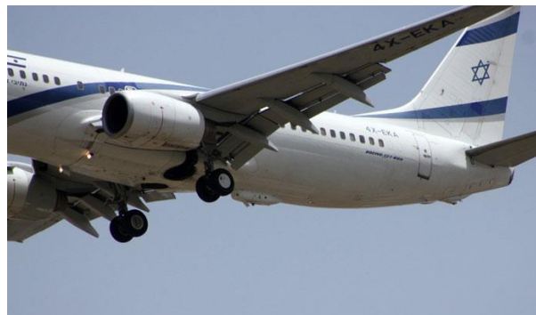
7. kép Az Elbit Systems C-MUSIC DIRCM 10 podja az ElAl repülőgépén [15]

Mégis, a C-MUSIC elnevezést kapott izraeli változat az ELAL első polgári Boeing 737-800 polgári utasszállító repülőgépére minősítést szerzett változat. (7. kép)