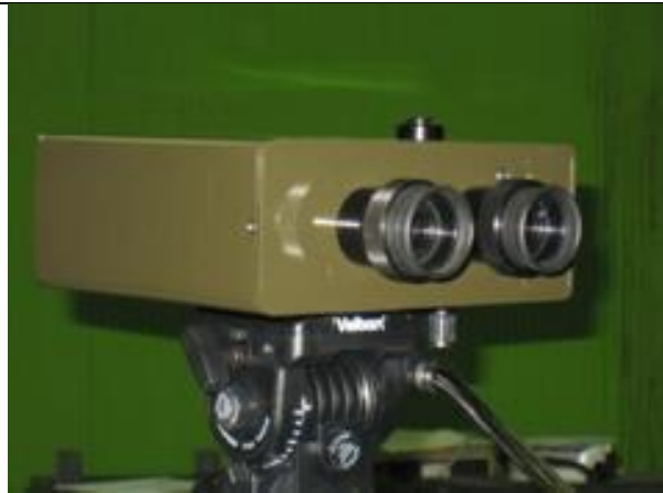
2. kép Lézeres katonai távmérő [8]

A katonai célú eszközökön a piros színű irányzófény áruló lehet, ezért a felderíthetőség csökkentése céljából a célzást optikai távcsővel végzik, a mérést is a nem látható fénytartományban működő lézer segítségével végzik el.