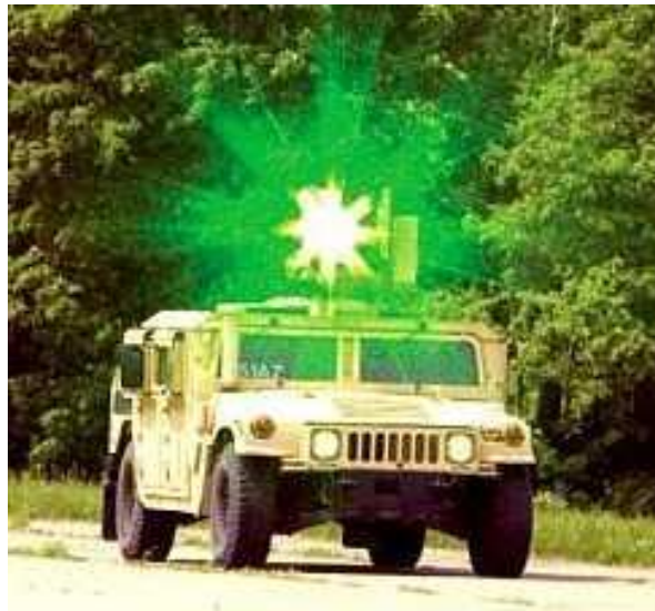
4. kép. Járműre szerelt laser dazzler [10]

A kis energiájú lézerek egy másik csoportja emberek ellen irányul. A dazzlerok 7 elsősorban a szem kápráztatására szolgálnak. A célszemély megvilágítása esetén önkénytelenül behunyja a szemét, elfordul vagy fedezékbe húzódik, de mindenképpen zavar keletkezik harc közben. A SaberShot típus a kézfegyverekre illeszthető, zöld színű félvezető lézer. Gombnyomásra kapcsolható be és világítja meg a célt. A gyakorlatban komoly pszichés hatást tapasztaltak az alkalmazása során, hiszen a célszemély a besugárzásra rejtőzködéssel reagál. A kézi változata 500 m-ig, a járműre épített változata 2000 m-ig hatásos. (4. kép)