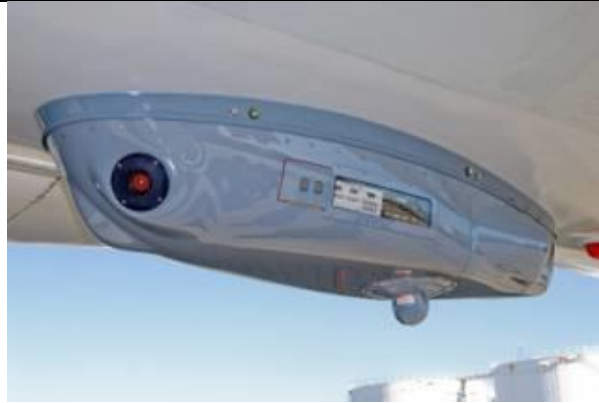
6. kép A Guardian rendszer felszerelt állapotban [13]

2014. március 4-én jelent meg egy hír arról, hogy Izrael készen áll arra, hogy lézeres rakétavédelemmel szerelje fel polgári utasszállító repülőgépeit [14]. A hírben szereplő Elbit Systems által kifejlesztett SkyShield (Égi Pajzs) nevű rendszer ugyanúgy működik, mint a fentebb leírt Guardian. A repülőgép hasára utólag is felszerelhető konténerben az alsó légteret figyelő infravörös érzékelők találhatók, amelyek a rakétaindítás intenzív hőkisugárzását észlelik. Az irány meghatározása után egy elfordítható lézerforrás sugározza be a rakéta fejrészében található nagyérzékenységű hőpelengátort, amely a túlterhelés hatására telítésbe mehet, vagy akár tényleges fizikai sérülést is szenvedhet, így a szabályzórendszer a kormányműveknek nem képes korrekt utasításokat kidolgozni, a rakéta célt téveszt, és előbb-utóbb megsemmisül. A technika réges-rég ismert, az amerikai Lockheed Martin több hasonló rendszert is fejlesztett, elsősorban katonai célokra, helikopterek, szállító repülőgépek védelmére.