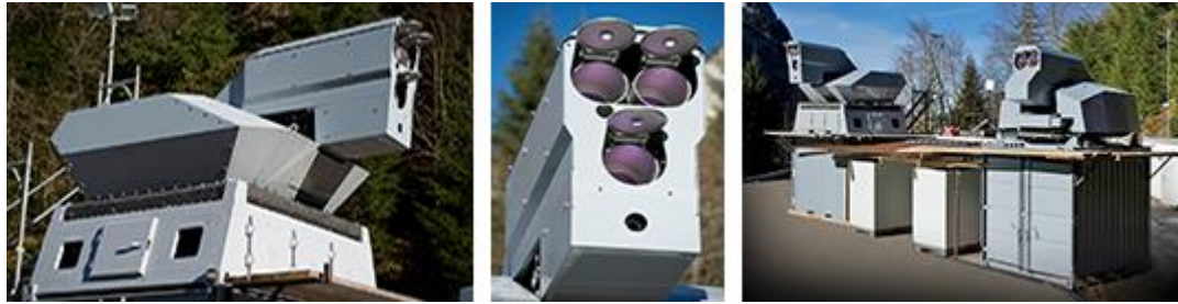
16. kép A német Rheinmetall lézerágyúja [21]

a Rheinmetall a saját fejlesztésű BST (Beam Superimposing Technology – Sugár-szuperpozicionáló Technológia) segítségével fogja egybe egy 20 és egy 30 kW-os nyalábbal [21]. (16. kép)