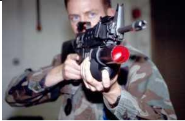
5. kép A Saber-203 vakító eszköz a fegyverre szerelve [11]

Ezen lézerek teljesítményük alapján csupán az emberi látás zavarására, a kritikus pillanatokban figyelemelterelésre szolgálnak, mert egyébiránt a lézeres szemet roncsoló sugárzók harctéri alkalmazását hadijogi egyezmények tiltják. Ettől függetlenül feljegyzett már a történetírás ilyen jellegű súlyos sérüléseket is.