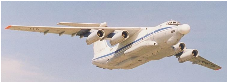
14. kép Az Almaz/Beriev A60 lézerfegyverrel épített repülőgépe [19]

Légi és földi lézerprogrammal 12 rendelkezik Oroszország is. Az Almaz/Beriev A60 13 repülőgépet 1981-ben, majd a másodikat 1991-ben építették. A hordozó egy IL-76MD, a fedélzeten széndioxid lézerrel. A forgatható tükörrendszer az orrban helyezkedik el. (14. kép.)