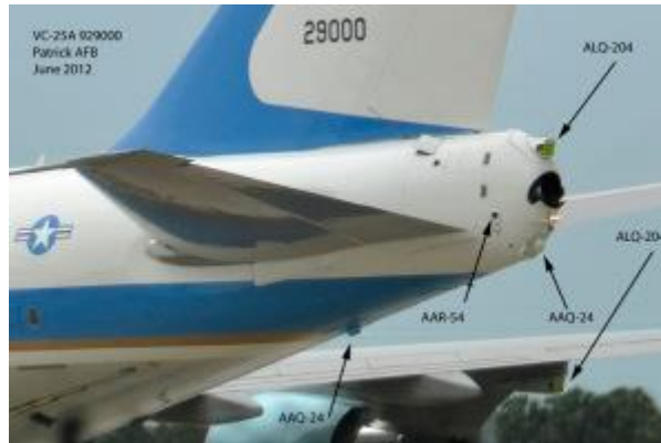
8. kép Az Air Force One farokrésze az AN/ALQ-204 rendszerrel [16]

Rendelkezik ezen kívül egy AN/AAR-54(V) rakéta indításra figyelmeztető besugárzásjelzővel és egy AN/AAQ-24 NEMESIS DIRCM rendszerrel, valamint képes infracsapdák kivetésére is [16].