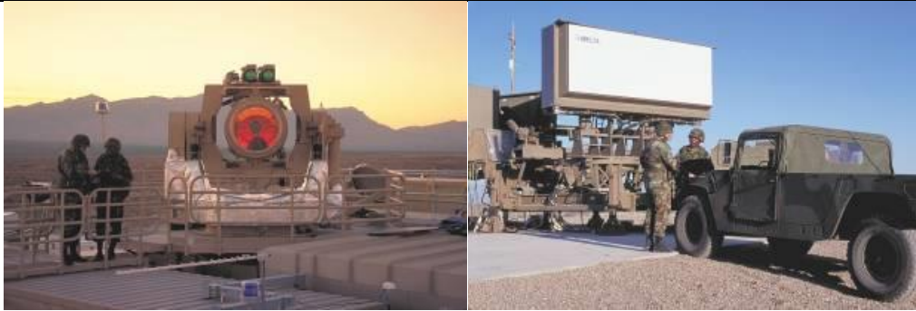
11. kép A THEL rendszer lézeregysége és radarja [19]