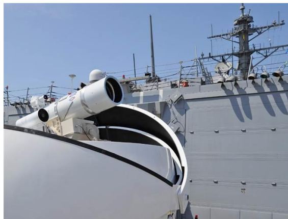
15. kép A hajófedélzeti lézer fegyver [20]

Az NBC NEWS 2013. április 8-án hozta le a hírt, miszerint az Egyesült Államok haditengerészete tulajdonképpen elsőként ténylegesen rendszerbe állítja a kimondottan hajófedélzeti alkalmazásra tervezett lézerfegyvert, a LaWS-t 14 amelyet a USS Ponce fedélzetén teszteltek és elsőként a USS Dewey-re telepítettek [20]. (15. kép)