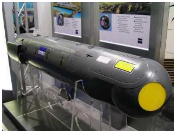
3. kép A Litening III. célmegjelölő konténer [9]

A lézeres célmegjelölés másik alkalmazott területe a csapásmérő fegyverrel kombinált célmegjelölő eszköz, amely lehet a fegyveren, amely a célba való becsapódásig rajta tartja a megvilágító sugarat a céltárgyon és a pl. páncéltörő rakéta önirányító feje a célról visszavert jelre vezeti rá magát. Ennél korszerűbb megoldások is léteznek, pl. amikor egy pilóta nélküli repülőgép, vagy egy, a kötelékben repülő másik repülőgép végzi a célmegjelölést és a csapásmérést egészen máshonnan váltják ki. Ennek azért van jelentősége, mert a lézeres célmegjelölést besugárzásjelzővel detektálni lehet és a megvilágítás irányába valamilyen ellentevékenységet lehet folytatni, védelmi rendszabályt életbe léptetni, ugyanakkor a csapásmérő eszköz valós helye rejtve marad és az ellentevékenység sem éri olyan hatékonysággal. A magyar Gripen repülőgépek is rendelkeznek egy Litening III. típusú lézeres célmegjelölő konténer rendszerrel. (3. kép)