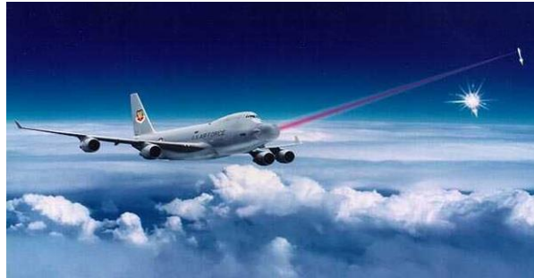
9. kép A YAL-1A repülőgép fedélzeti lézerfegyver hordozója [18]

lézerfegyver program volt. A hordozó eszköz egy átalakított Boeing 747-400F volt, amely a 9. képen látható.