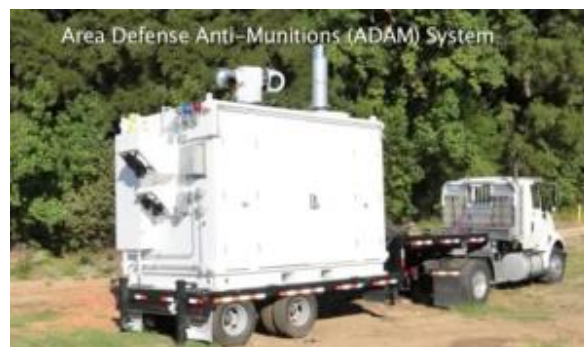
17. kép Az ADAMS rendszer [22]

Hasonló a Lockheed Martin ADAM – Area Defense Anti-Munitions system – Lövedék Elleni Területvédő Rendszere. Egy nyerges vontató konténerében helyezkedik el a 10 kW teljesítményű lézerforrás. Mintegy 5 km távolságról céloz, és mintegy 2 km-re semmisíti meg a célokat, harcászati rakétákat, lövedékeket [22]. (17. kép)