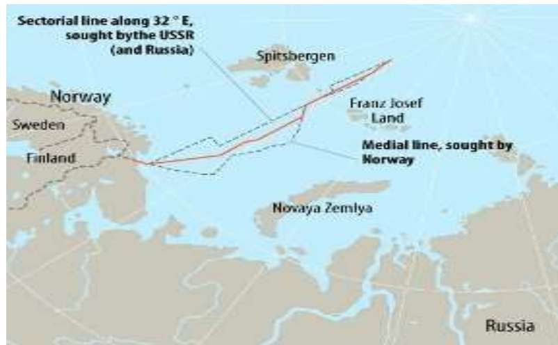
1. ábra A megállapított határvonal az Orosz - Norvég határon 14

felszólította Oroszországot, hogy nyújtson be tudományos bizonyítékokat a terület hovatarozásáról.