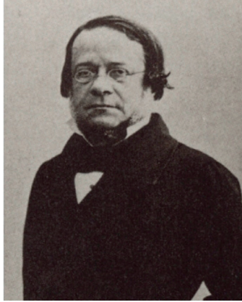
3. ábra Daniele Manin [17]

A műveletet az osztrákok újra megpróbálták augusztus 22-én, a becslések szerint 200 léggömbbel, amelyek mindegyike több mint 14 kg (30 £) robbanóanyagot szállított. Ezúttal néhány ballon elérte a célját, bár a sérülések minimálisak voltak.