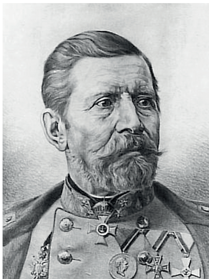
5. ábra Franz von Uchatius [19]

Franz von Uchatius (5. ábra) egy rendkívül okos osztrák mérnök és tüzérségi tiszt volt. Karrierje során erősebb ötvözeteket fejlesztett ki az ágyúk számára, füstmentes poron dolgozott, és a balisztikus tanulmányok előadásához 1853-ban egyfajta animációs kivetítőt fejlesztettek ki.