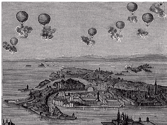
4. ábra Sun-Drone Balloons Bomb Venice [18]

Daniel Manin (1804–1857) Velencében született zsidó család sarja. Számos nyelvet tanult, zsidó és keresztény vallású könyveket írt. Jogtudott ember lévén elsődleges célja a jogi „küzdelem” volt. 1848-ban ő vezette a Velencei köztársaságot az osztrákok támadása alatt. Ez az újfajta háborús filozófia egy új dimenziót nyitott a reguláris hadseregek közötti harcérintkezésben, mert felvetette annak a lehetőségét, hogy a polgári lakosság jóval a hadseregek elülső vonala mögött a támadás célpontjává váljon. Ezzel a háborús fogalmakhoz hozzá lehetett adni egy új szót, a „légitámadás” kifejezést.