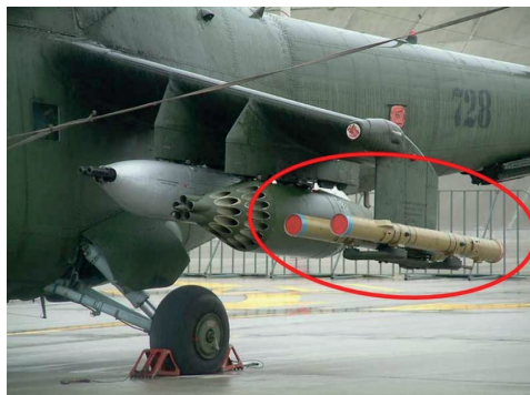
14. ábra 9M114 típusú „STURM” irányítható rakéta [23]

A Mi-24 másik irányítható rakétafegyvere 9M114 „STURM” irányítható rakétafegyverzet (14. ábra). A páncéltörő rakéta rendeltetése az ellenséges páncélozott és könnyen páncélozott célok, illetve megerősített építmények, erődítmények, betonépítmények megsemmisítése. A hangsebesség felett repülő rakéta rádióvezérlés segítségével vezethető rá a célra.