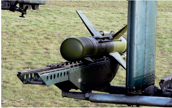
13. ábra 9M17P típusú „FALANGA” irányítható rakéta [22]

A Mi-24 egyik irányítható rakétafegyvere a 9M17P típusú „FALANGA” (13. ábra). Rendeltetése az ellenséges mozgó és nem mozgó kisméretű páncélozott és könnyen páncélozott célok megsemmisítése.