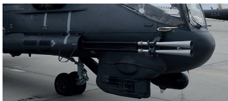
10. ábra A GS-2-30 gépágyú [19]

A Mi-24P változat törzsszerkezetének jobb oldalára épített ikercsövű GS-2-30, 30 mm-es gépágyú (10. ábra), az ellenséges élőerő, illetve enyhén páncélozott járművek pusztítására alkalmas. A gépágyú Gast-rendszerű, gázvezetetéses. A két párhuzamos cső felváltva tüzel, a kilőtt lövedék mögül visszavezetett nagynyomású gáz végzi a gépágyú meghajtását, a csövek fölött található gázdugattyúk segítségével.