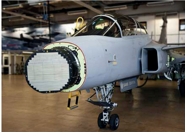
4. ábra PS/05A lokátor [13]

A lokátor képességei kapcsán meg kell említeni a nagy távolságú keresés/követés funkciót, a felszíni célok távolságmérését, a nagyfelbontású térképezési funkciót, illetve az automatikus gépágyú- és rakéta-tűzvezetést.