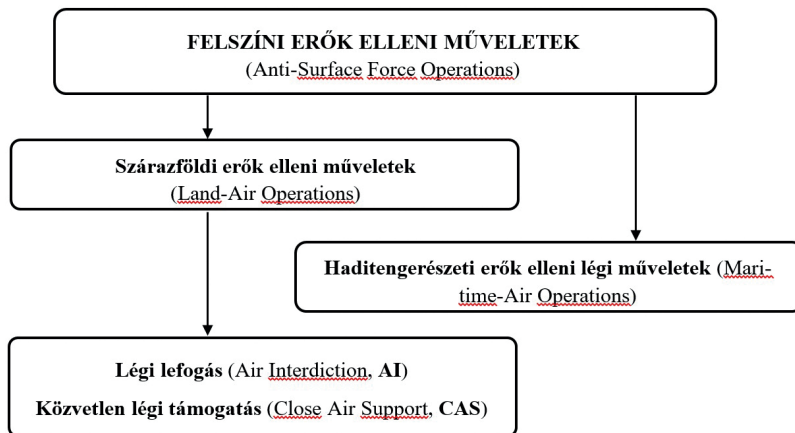
2. ábra A légi műveletek típusai [4]

A tűztámogatásban való részvétel elemzésénél feltétlenül ki kell emelni, hogy a magyar légierő e típusú feladatokba bevonható harcászati repülő és helikopter erői a támadó légi támogatás rendszerében oldják meg feladataikat. Az AJP 3.3 alapján meghatározhatóvá váltak a légierő támadó légi támogatásának fajtái, amelyek a közvetlen légi támogatás, a harcmező légi lefogása, légi lefogás a mélységben és a harcászati légi felderítés.