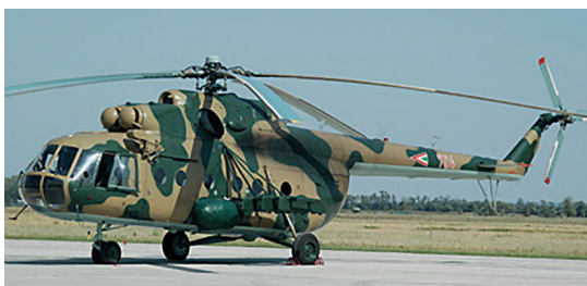
15. ábra Mi-17 szállítóhelikopter [24]

A helikopter erők tűztámogatási képességének vizsgálatakor meg kell említeni azt a képesség-összetevőt, amelyet a szállítóhelikopterek képesek biztosítani. A Magyar Honvédségnél rendszeresített Mi-8/17 szállítóhelikopterek (15. ábra) fő feladata a légi-mozgékonyasági műveletek biztosítása, a légi szállítás, mégis rendelkeznek mind nemirányítható rakéta fegyverzettel, mind pedig bombafegyverzettel. Ezek a fegyverek azért lettek rendszeresítve e helikopterek fedélzetére, hogy műveleti körülmények között képesek legyenek a saját le szállóhelyük esetleges biztosítására.