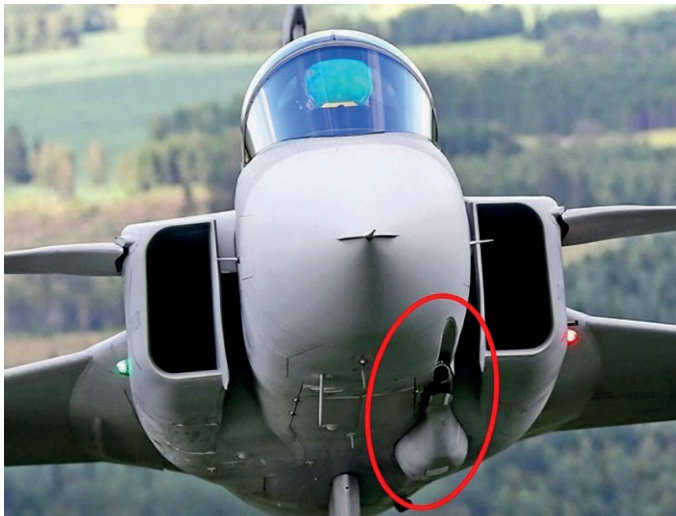
5. ábra Mauser BK-27 gépágyú elhelyezkedése a JAS-39-en [14]

A felszíni földi erők, illetve a nem vagy csak enyhén páncélozott járművek pusztítását biztosítja a repülőgép törzsének bal oldala alatt, a levegőbeömlő nyílás vonala mögé épített Mauser BK-27 gépágyú (5. ábra).