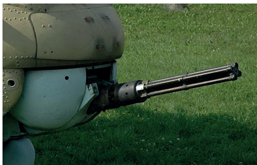
9. ábra A JakB-12,7 géppuska [18]

A Mi-24D és V változatának orr-részébe épített JakB-12,7 géppuska (9. ábra) egy 12,7 mm-es, négycsövű, gázmeghajtású, forgócsöves fegyver, amely a forgatható tornya segítségével 60°-ban fordítható jobbra, balra valamint le és 20°-ban felfele irányba.