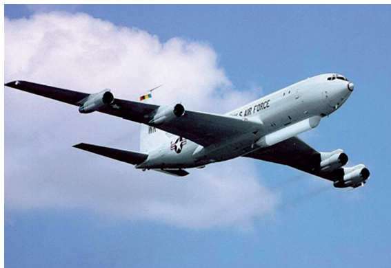
1. ábra Boeing 707-300 E-8 JSTAR [2]

A fogalom második elemeként a harci repülőeszközöket, illetve azok harcát kell kiemelni. A tűztámogatásba bevonható harci repülőeszközök lehetnek harcászati repülőök, illetve helikopter erőkhöz tartozó harci helikopterek. A harci repülőeszközök a tűztámogatási feladataikat a fedélzeti tűzeszközök által biztosítják. Ezek lehetnek irányítható és nemirányítható rakéták, légbombák, vagy pedig fedélzeti géppuskák és gépágyúk. Az említett fegyverek alkalmazási köre nagymértékben függ a pusztítandó ellenséges erők és eszközök, infrastruktúra természetétől (páncélvédezettségétől).