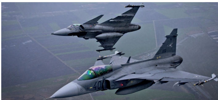
3. ábra JAS-39 vadászrepülőgép [12]

A Magyar Honvédségnél rendszeresített a harcászati repülőgép a JAS-39 Gripen (3. ábra). Ezt a negyedik generációs könnyű repülőgépet, a svéd Saab, Ericsson, Volvo és Celsius Aerotech cégekből megalakult konzorcium, az Industrigruppen JAS gyártja. Tervezésénél alapvető szempont volt a többcélú alkalmazhatóság, amit a típusneve is tükröz. A JAS a Jakt (Vadász), Attack (Támadó), Spaning (Felderítő) szavak rövidítése. A típust – elsőként a Svéd Királyi Légierőben – 1996-ban állították szolgálatba.