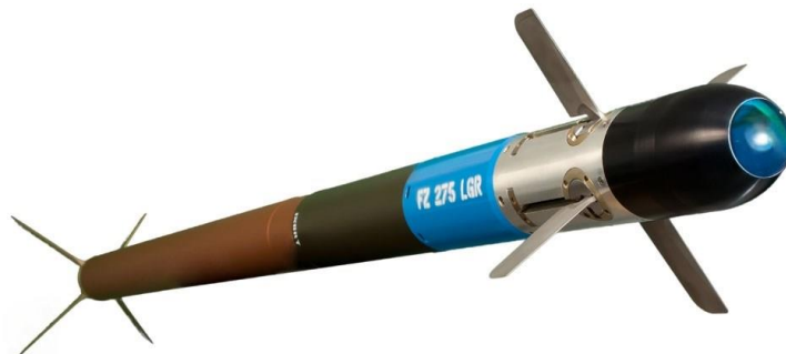
16. ábra FZ275 félaktív lézer önirányítású rakéta [8]

A célmegjelölés történhet a rakéta indítása előtt (LOBL) 28 vagy után (LOAL) 29 is, de akár egy másik platformról is, például egy katona egy célmegjelölővel, vagy egy másik légi jármű is megteheti. Ez a sokoldalúság a helikopter számára sokkal nagyobb túlélőképességet és a támadásra való képességet biztosít anélkül, hogy az ellenséget meg kellene közelítenie. FZ275 félaktív lézer önirányítású rakéta ürmérete 70 mm, hatótávolsága 6000 m, szórása kisebb, mint 1 m [47].