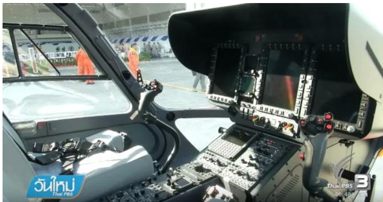
4. ábra Műszerfal [8]

Az egyetlen képernyőn megjelenített összes repülési paraméter célja, hogy segítse a pilótát a helyzet gyors elemzésében és értékelésében annak érdekében, hogy továbbra is teljes mértékben csak az adott feladat végrehajtására koncentráljon.