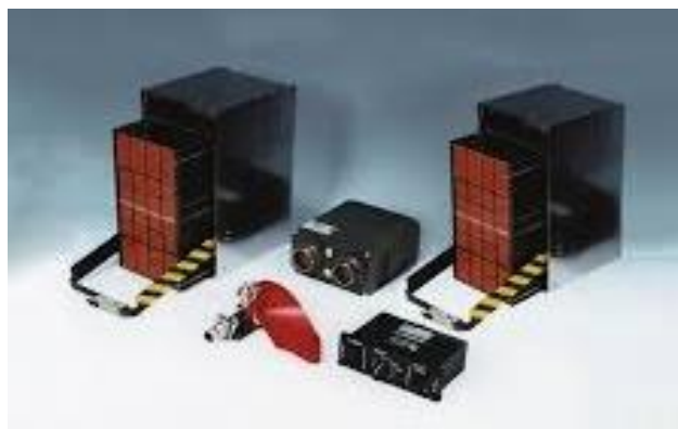
10. ábra Saphir-M infracsapda és dipól kivető [37]

A H145M rendelkezik korszerű infracsapda kivetővel (10. ábra). Az új anyagokat tartalmazó infracsapdák tulajdonképpen lassan égnek, így biztosítva a kellően alacsony hőmérsékletet és a hosszú idejű égést. A viszonylagosan alacsony égési hőmérséklet miatt a hordozó repülőeszköz rejtve maradhat földi vizuális felderítés elől, ezáltal biztosítva légvédelmi fegyverek elleni védelmet, valamint a minél jobb spektrális hasonlóságot [36].