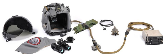
12. ábra Sisak célzó és kijelző [8]