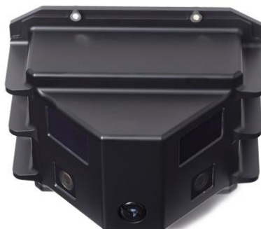
8. ábra ALTAS 2Q(B) LWR [30]