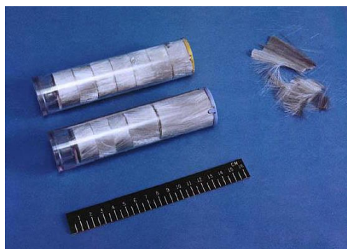
11. ábra RR-144 és RR-129 dipól [38]

A dipólok általában alumínium vagy egyéb fémmel bevont üvegszálból vagy műanyagból készülnek (11. ábra). Ezek kivetése mintegy függőnyként álcázza a légi járművet és ezáltal hamis célokat generál a fenyegetést jelentő rádiólokációs eszközök számára.