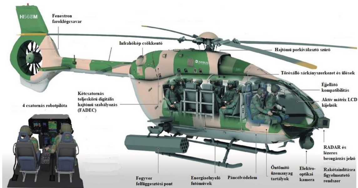
5.ábra Túlélőképességet növelő megoldások [20]

A megbízhatóságot növelő elemek között szerepel a létfontosságú rendszereknél a redundanciás struktúra alkalmazása. A 2 db hajtómű, illetve a hajtómű vezérlésnél, a helikopter repülésvezérlő rendszerénél alkalmazott tartalék rendszerek nagyban hozzájárulnak a sebezhetőség csökkentéséhez. A három, esetlenként négyszeres közvetlen elektromos kapcsolat mellé tartalékként mechanikus rendszereket is kiépítenek biztosítva a megfelelő megbízhatóságot [15].