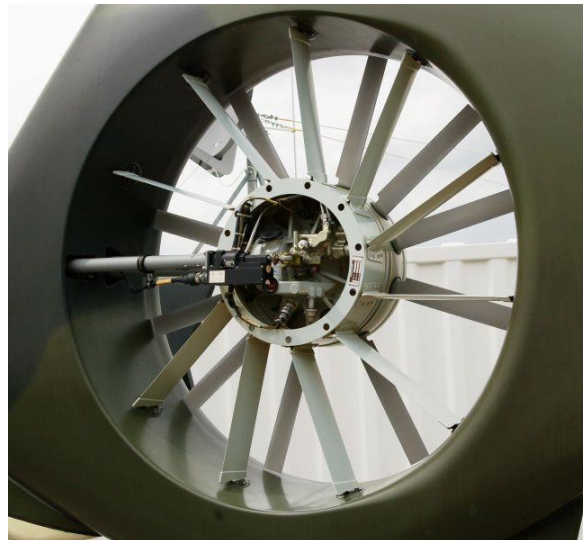
7. ábra Fenestron faroklégcsavar [26]

A helikopterek akusztikai felderíthetőségének csökkentése is fontos, de csak másodlagos cél, mivel hangjelek alapján irányítható automatikus fegyverek egyelőre nem léteznek. Természetesen az alacsonyabb zajszint, a kézi fegyverekkel szemben javítja a túlélés esélyeit [18]. A H145M a zaj és a vibráció szint további csökkentése érdekében „Fenestron” kialakítású faroklégcsavarral van felszerelve, amely kompozit anyagból készült aszimmetrikus lapátokat tartalmaz [24].