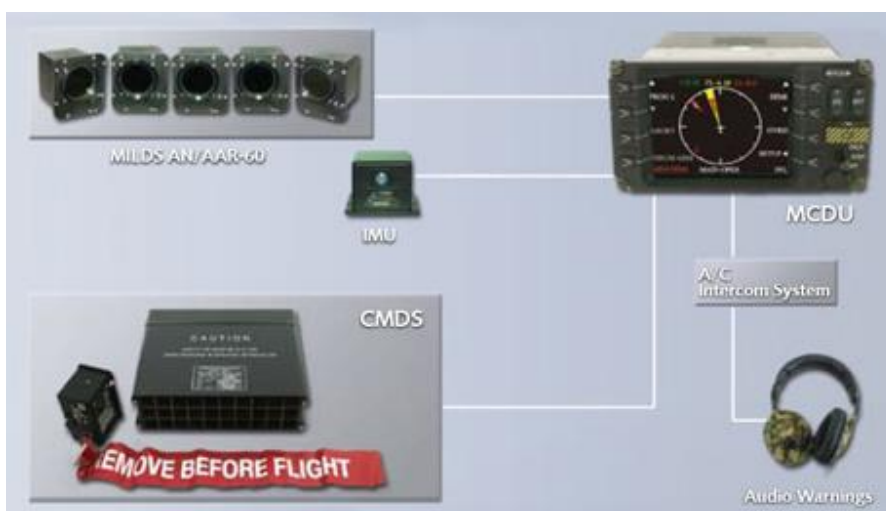
9. ábra AN/AAR-60 rakétaindításra figyelmeztető rendszer [35]

A modern rakétaindításra figyelmeztető eszközök az impulzus-doppler RADAR (PDR) 23 technológia, illetve az infravörös (IR) 24 és/vagy az ultraibolya (UV) 25 tartományú elektromágneses sugárzás érzékelését felhasználó opto-elektronikai rendszerek alapján működnek. A korszerű berendezések az emissziós adatokat is felhasználhatják az ellenséges rakéták típusának meghatározására, hogy lehetővé tegyék a célzott és megfelelő ellenintézkedéseket. A H145M típusú helikopteren alkalmazásra kerülő ultraibolya tartományban működő AN/AAR-60 típusú berendezés [33] előnye (9. ábra), hogy sokkal alacsonyabb számú a téves riasztásokból adódó probléma az IR alapú rendszerekhez képest, emellett egyszerűbb műszaki kivitelű, bármilyen időjárási körülmény között alkalmazható, illetve nincs szüksége külön hűtésre és központi jelfeldolgozó rendszerre, mert az egyes szenzorok jelei külön-külön kerülnek feldolgozásra. Hátránya, hogy nagyobb magasságban kisebb a felderítési hatósugara, nem biztosít aktuális távolsági adatokat és csak a működő hajtóművel közeledő rakétákat érzékeli, amelyek hőt bocsátanak ki. Amint érzékeli a közeledő rakétát, a rendszer figyelmeztető jelet ad a személyzet részére és vizuálisan is kijelzi a rakéta, repülő eszközökhöz viszonyított helyzetét, majd automatikusan megkezdi a dipól és az infracsapdák kilövését [34].