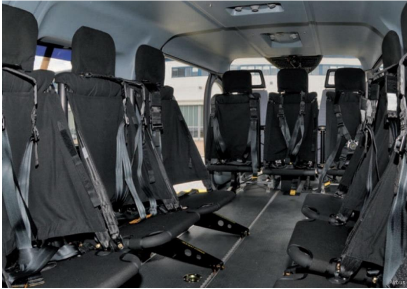
6. ábra Speciális ülés kialakítás [23]