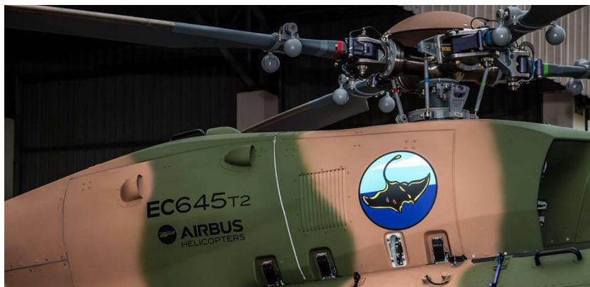
3. ábra Forgószárny bekötés [8]

vezérlésének elve, csak a hagyományos csuklók szerepét különféle, előre meghatározott rugalmasságú, illetve csillapítási tulajdonságú anyagok veszik át [9].