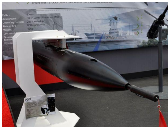
14. ábra Nexter NC621 gépágyú konténer [8]

A Nexter NC621 20 mm-es gépágyú-konténer (14. ábra), amit szintén a helikopterek és hangsebesség alatti merevszárnyú repülőgépen történő alkalmazásra terveztek, a M621 20 mm-es gépágyút tartalmazza. A gépágyú elméleti átlagos tűzgyorsasága 750 lövés/min, hatásos lőtávolsága 2000 m, lőszerjavadalmazása 180 lőszer [43].