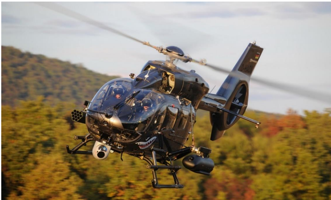
1. ábra Az Airbus H145M helikopter [2]

A publikációban a szerző arra keresi a választ, hogy ennek a helikopter típusnak a túlélőképességet növelő technikai megoldásai, hogyan járulnak hozzá a Magyar Honvédség forgószárnyas képességének megújításához, mivel a helikopterek harctéri túlélésének biztosítása elsődleges fontosságú feladat a műveletek tervezésben és a végrehajtásában egyaránt.