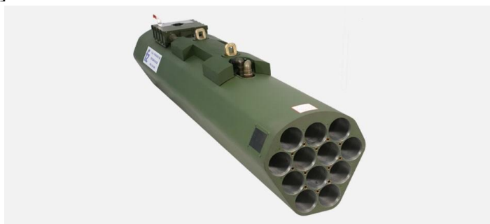
15. ábra FZ231 rakéta indító blokk [8]