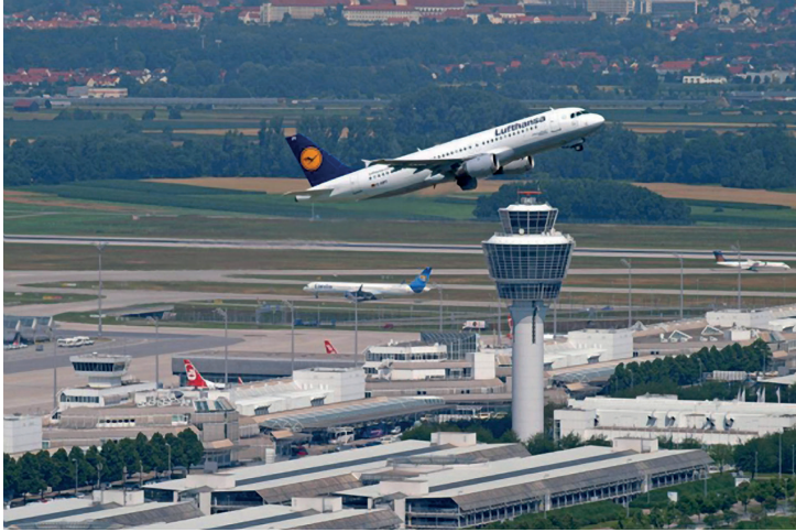
3. ábra A Temesvári nemzetközi repülőtér [8]

Temesvár nemzetközi repülőtérét a többségi állami tulajdonú tőkével rendelkező Traian Vuia részvénytársaság üzemelteti, amely gazdasági alapon szerveződik és működik. A finanszírozás forrásai saját bevételekből, az állami költségvetésből, banki hitelekből, külső szerződésekből vagy az állam által garantált hitelekből származnak, amelyeket a közösségi versenyszabályoknak megfelelően nyújtanak, ezt egészítik ki a hatályos törvények alapján nyújtott vissza nem térítendő külföldi pénzeszközök, valamint a magántőke és más különféle jogilag meg-alapozott források.