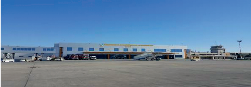
2. ábra A kolozsvári Avram Iancu repülőtér [3]

Ez a repülőtér tökéletes választás azoknak, akik az ország északi és északnyugati részén szeretnének belépni az országba. A kolozsvári Avram Iancu nemzetközi repülőtér Kolozs megye Tanácsának 1997 óta fennálló szervezete. Románia második legnagyobb repülőtere és az első a regionális repülőterek között Romániában. Kolozsvárnak valamivel több mint 300 ezer, míg Kolozs megyének mintegy 700 ezer lakosa van. Hasonlítsuk össze a kolozsvári repülőteret olyan osztrák város repülőterével, mint Graz, amely lakosainak száma közel 284 ezer volt 2017-ben. Graz annak a Stájerországnak a székhelye, amelynek a lakossága több mint 1 millió 200 ezer, és amelynek a repülőtere minden évben mintegy 1 millió utasforgalmat bonyolít le, akkor azt tapasztalhatjuk, hogy a Kolozsvári Avram Iancu nemzetközi repülőtér utasforgalma Grazcal szemben már 2017-ben jelentősen meghaladta a 2 és fél milliót (1. táblázat).