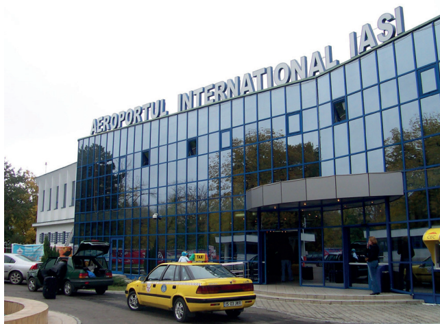
4. ábra A Iași nemzetközi repülőtér [10]

és a szomszédos megyék: Bacaut, Botosanit, Neamt, Suceavat és Vasluit. A szomszédos Moldova is idetartozik, mivel nagyszámú román állampolgára van, és az oda, illetve onnan utazók elsősorban Iași repülőterét használják. Tehát hat romániai megye, az északkeleti régió része, összességében több mint 3,8 millió lakos és 37 000 km 2 terület alkotja a Iași repülőtér vonzáskörzetét és ezért lett Románia északkeleti részének legfontosabb és legnagyobb forgalmú regionális repülőtere (4. ábra).