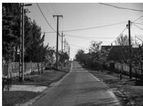
2. ábra • Légvezeték-szabályozás képi megjelenítése a TAK-ban

Érpaták szövegesen is kiemeli a Településképet romboló légvezetéseket: „Sajnos e településen is problémát jelent a légvezetékek esztétikai képet is jelentős mértékben romboló hatása, érdemes lehet megvizsgálni, idővel ezeket hogyan lehetne itt is földkábelekkel kiváltani, mivel sok esetben új telepítés esetén már csak kifejezetten ezek létesítését engedélyezik.” 33