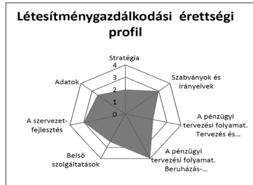
2. ábra • EN 15221-5:2011 Guidance on Facility Management processes

Az érettségi profil mint egyszerű tesztlap segítségével meg lehet állapítani egy adott létesítménygazdálkodási szervezet felkészültségét, és ezáltal továbbfejleszthetők a korábban kevésbé tudatosan működtetett területek. Alább egy példát mutatunk erre: