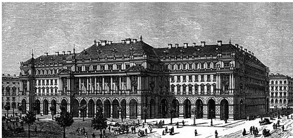
2. ábra • Földművelés-, Ipar- és Kereskedelemügyi Magyar Királyi Minisztérium homlokzatának távlati képe (1894)

A vízügyi igazgatás fejlődéstörténetében fontos mérföldkőként említhető az az 1885. évi IV. törvénycikk, amely a Földművelés-, Ipar- és Kereskedelemügyi Magyar Királyi Minisztérium többfunkciós állami épületének (2. ábra) felépítésére határozott meg kölcsönfelvételi lehetőséget. A minisztériumi épületet Bukovics Gyula építész tervezte, az ünnepélyes alapkövetétel 1886. január 2-án történt. 10