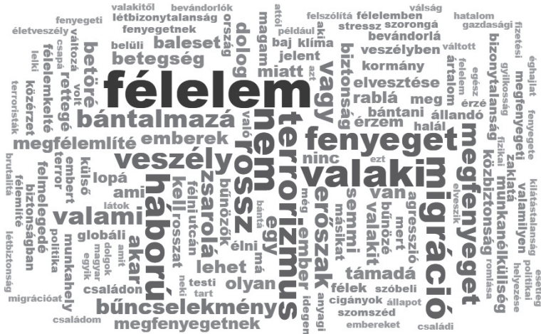
2. ábra: A közvélemény-kutatásban megkérdezettek véleménye a fenyegetésről – nem kategorizált válaszok