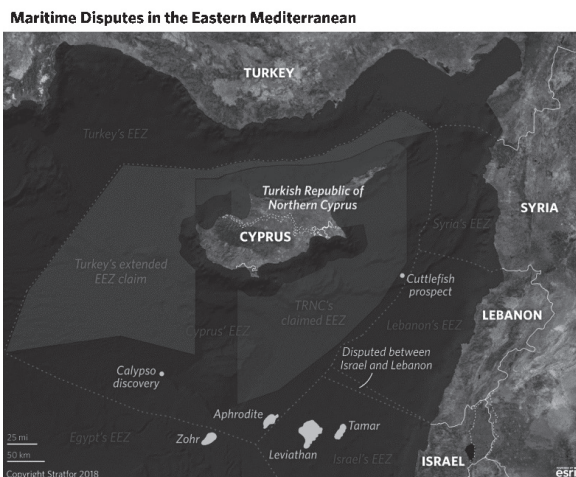
2. ábra: A kelet-mediterráneumi gázmezők és területi viták.

belügynek tekinti a gázmezők kérdését (illetve az alkudozást erről a török cipriótákkal). Nem zárkózik el a tárgyalásoktól, azonban minden kutatási akciót a saját szuverenitásának megsértéseként értelmez. 18