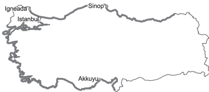
1. ábra: A tervezett törökországi atomerőművek helyszíne

Ankara három atomerőmű építését tervezi a közeljövőben. Az elsőt a dél-törökországi Akkuyuban, a másodikat a Fekete-tenger partján, Sinopban, a harmadikat pedig a bolgár határhoz közeli İgneada területén. A sinopi erőmű megépítésére kiírt tendert 2013-ban egy japán–francia konzorcium nyerte meg. Az erőmű a BOT ( Build, Operate, Transfer ) modell alapján működött volna, és az eredeti tervek szerint 2023-ban állt volna működésbe az első reaktor. Sajtóhírek szerint azonban 2018 végén a japán cég ( Mitsubishi Heavy Industries ) finanszírozási gondok miatt – a kivitelezési költségek a fukusimai katasztrófa után bevezetett plusz biztonsági intézkedések szükségessége, valamint a török líra gyengülése miatt az eredetileg tervezetthez képest kétszeresükre nőttek – visszalépett a projektből. 22 A harmadik erőmű építését szintén kétségek lengik körül, elsősorban az amerikai Westinghouse közelmúltbeli (2017-es) csődje miatt – igaz, a vállalat azóta (2018-ban) tulajdonosváltást és átszervezést követően sikeresen kikerült a csődvédelmi eljárás alól. A Törökország európai részén épülő erőmű a Westinghouse és a kínai State Nuclear Power Technology Corporation (SNPTC) vállalat együttműködésében valósulhatna meg, amiről 2014-ben kezdték meg a tárgyalásokat. 23