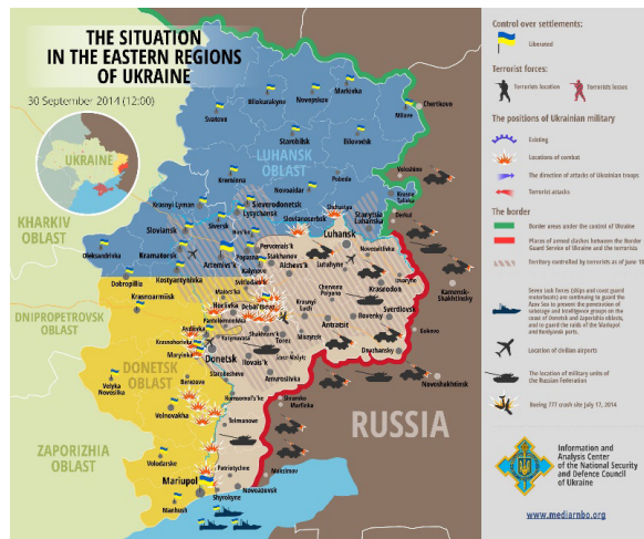
1. térkép: A kelet-ukrajnai front helyzete 2014. szeptember 30-án, 2015. február 24-én és 2017. február 25-én