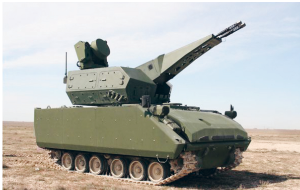
2. ábra: Korkut – 35 mm-es önjáró légvédelmi rendszer