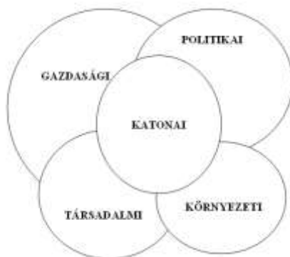
1. sz. ábra: A biztonság dimenzióinak kapcsolata a katonai dimenzió szemszögéből

A katonai dimenzió és a biztonság más dimenziói között jelentős átfedések találhatók. A közös részhalmazok nagysága a dimenziók közötti kapcsolat szorosságát is ábrázolják. A legszorosabb kapcsolat a politikaival áll fenn, mert egymás eszközeit is használják, de jelentős függésben áll a gazdasági dimenzióval, amely biztosítja a katonai dimenzió eszközeinek fenntartását. A társadalmi dimenzió szintén a katonai dimenzió fő elemét, vagyis a katonai erőt határozza meg az állomány biztosítását. Talán a környezeti dimenzióval van a legszűkebb a kapcsolata, de a XXI. században az éghajlatváltozások miatt, valamint a természet védelmének felértékelődésével egyre nagyobb hatást gyakorol a katonai dimenzióra.