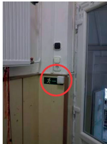
2. kép. A nyitógombra rányílik az ajtó