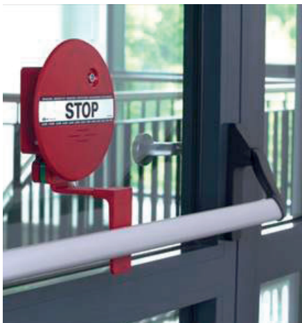
11. kép. Riasztóval felszerelt MSZ EN 1125 szerinti pánikrudas vészkijárat [28]

Óvodákban és bölcsődékben az üzemeltetők azt kívánják elkerülni, hogy a gyermekek felügyelet nélkül elhagyják az épületet, ugyanakkor biztosítani kívánják a vészkijáratok felnőttek általi nyithatóságát. Erre az igényre megfelelő megoldást jelenthet az olyan kialakítású vészkijárat, amely rendelkezik egy normál magasságban felszerelt kilincssel, amely jelzőberendezéshez kötött és ezenkívül egy olyan magasabbra szerelt kilincssel is, amelyet a gyermekek nem érnek el, de a felnőttek számára ezáltal az ajtó könnyen nyitható (12. kép).