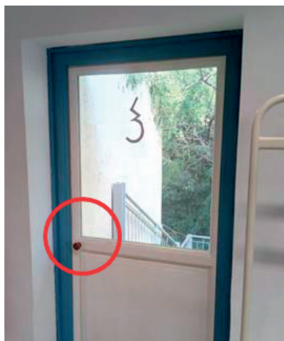
4. kép. Mágnessel rögzített vészkijárat fogantyúval, nyitó gomb nélkül, tűzjelzésre nyílik

Tolóajtók esetén a nyitást több esetben mozgásérzékelő vezérelte. Volt olyan létesítmény, ahol tápellátás hiányában a tolóajtó szárnyai csak kulccsal voltak nyithatók.