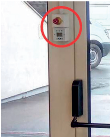
5. kép. Elektromos motorral rögzített vészkijárat pánikrúddal és vésznyitó nyomógombbal

volt, az állószárnyat tolózár rögzítette. Az ajtó előtt, a belső oldalon befelé nyíló kétszárnyú rács volt elhelyezve, amelyhez kulcs nem volt a kulcsdobozban, de az a vizsgálat időpontjában nem volt kulcsra zárt állapotban. A vizsgált ajtó 300 fő menekülését kellett biztosítsa.