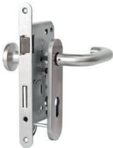
8. kép. MSZ EN 179 szerinti vészkijáratok zárai [16]

A vészkijáratok záraival több szabvány foglalkozik. A szabványos vészkijáratok zárai a menekülést bármikor lehetővé kell tegyék, így ezek zárva tartására a szabvány keretein belül nincs mód. Az ajtó nyitására a szabvány szerint egyetlen mozdulattal lehetőséget kell biztosítani, azonban az ilyen zárok nem alkalmasak olyan helyzetekben, mikor pánik kialakulására kell számítani, vagy a bent tartózkodók nem ismerik a vészkijáratok nyitásának módját vagy a nyitási irányt. Ez a zárfajta a menekülés irányával ellentétes irányba nyíló ajtóra szerelve is megfelel a szabvány előírásainak. Az ilyen szabványos vészkijáratok zárai esetén nem követelmény, hogy az ajtólapra kifejtett nyomóerő mellett (mint ami a tömeg nyomása hatására előfordulhat) is nyitható legyen. Az ajtó működtetőszervezete kilincs vagy nyomólap lehet. A vészkijáratok zárai esetén követelmény, hogy a működtetőszervezet működtetésével az ajtónak minden esetben nyílnia kell, függetlenül az esetleges kiegészítő eszközöktől, mint retesz, elektromos zár, beléptetőrendszer stb. [15].