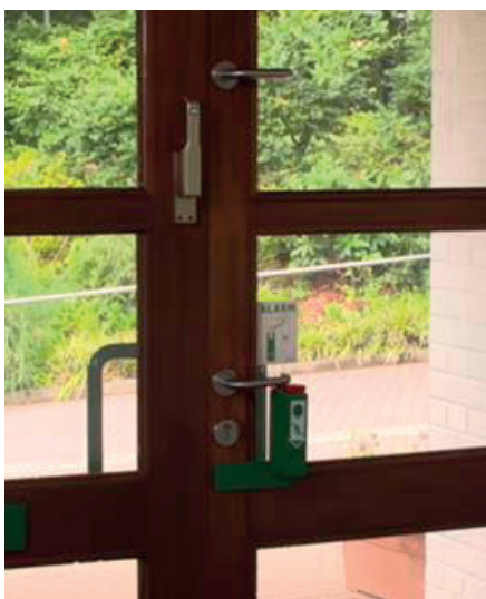
12. kép. Dupla kilincs egy óvoda vészkijáratú ajtaján [29]

Óvodákban és bölcsődékben az üzemeltetők azt kívánják elkerülni, hogy a gyermekek felügyelet nélkül elhagyják az épületet, ugyanakkor biztosítani kívánják a vészkijáratok felnőttek általi nyithatóságát. Erre az igényre megfelelő megoldást jelenthet az olyan kialakítású vészkijárat, amely rendelkezik egy normál magasságban felszerelt kilincssel, amely jelzőberendezéshez kötött és ezenkívül egy olyan magasabbra szerelt kilincssel is, amelyet a gyermekek nem érnek el, de a felnőttek számára ezáltal az ajtó könnyen nyitható (12. kép).