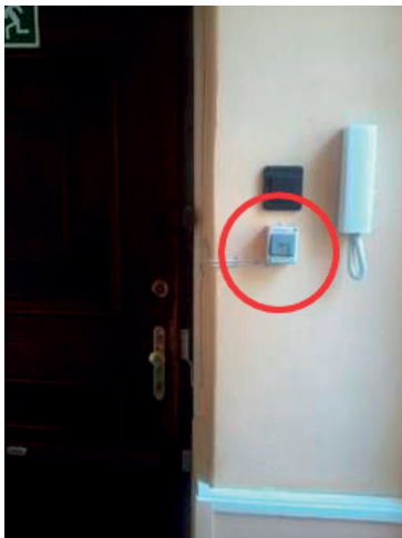
1. kép. Nyomógombbal nyitható vészkijárat

Az egyszárnyú ajtók esetén előfordult a nyithatóság biztosítása kilincssel, fali nyomógombbal (1. kép, 2. kép), érintőkártyával (3. kép), pánikrúddal, valamint kulccsal. Kétszárnyú ajtók esetén a nyílászárny nyithatóságát az egyszárnyú ajtóknál leírtakkal azonos módokon biztosították, az állószárny tolózárral volt nyitható a legtöbb esetben, de talákoztam pánikrudas megoldással is.