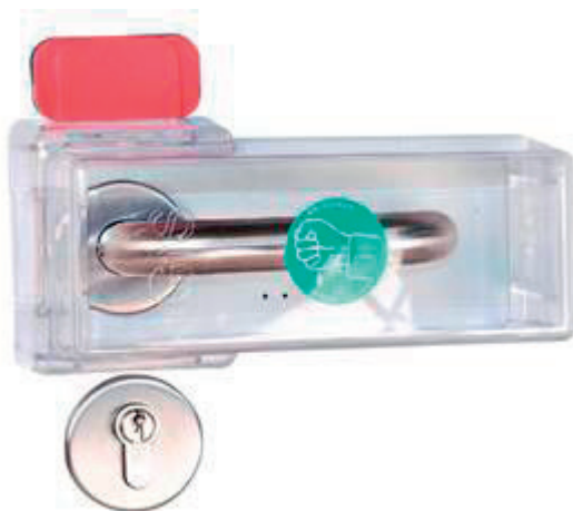
9. kép. Kilincsbúra, egy mozdulattal eltávolítható [24]

A vészkijáratokhoz utólagosan felszerelhető olyan berendezés, amely a kilincs vagy pánikrúd működtetése esetén helyi akusztikus jelzést ad, ugyanakkor a vészkijárat azonnali használhatóságát nem korlátozza [25] [26]. Megfelelő vizuális jelzések, feliratok és előirasztási funkció alkalmazásával a rendeltetéstől eltérő használat megelőzhető. Ilyen kialakításra mutat példát a 10. és a 11. kép.