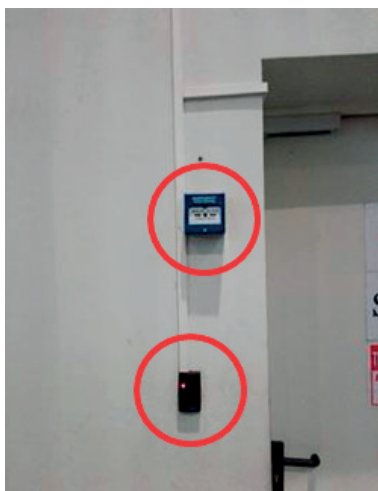
3. kép. Érintőkártyával nyitható mágnessel rögzített ajtó vésznyitó nyomógombbal

Ahol a nyílászárny nyitásához fali nyomógomb volt szükséges, ott változó volt annak kialakítása. Az elektromos zár szünetmentes tápellátása sehol sem volt biztosítva a vizsgált létesítményekben. Egyes esetekben az elektromos zár a tápellátás megszűnte után az ajtó szabad nyithatóságát biztosította, más esetekben ekkor csak a hengerzár kulccsal való nyitásával adott lehetőséget a menekülésre. Az ilyen elektromos zárat vezérelheti akár fali nyomógomb, akár érintőkártyás érzékelő. Találkoztunk olyan elektromos zárral ellátott ajtóval is, amelynek egyik oldalán sem volt kilincs vagy pánikrúd, ezért a tápellátás megszűnésével az ajtó csak kulccsal volt nyitható. A nyomógombbal nyitható ajtók többségénél az ajtó csak a nyomógomb nyomva tartása mellett volt nyitható. Az egyik vizsgált vészkijáratnál az ajtón belülről csak fogantyú volt elhelyezve kilincs helyett, az ajtót elektromágnes rögzítette, a nyitást csak a tűzjelző berendezés vezérlőjele váltja ki, nyitó gomb nem volt az ajtó mellett (4. kép).