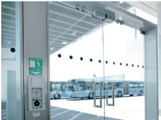
13. kép. Nyomógombbal nyitható vészkijárat MSZ EN 13637 szerinti kialakítással [30]

Ha a létesítményüzemeltetési igényeknek a csupán jelzést adó berendezésekkel felügyelt vészkijáratok nem nyújtanak kielégítő védelmet, úgy az MSZ EN 13637 szabványnak megfelelő vészkijáratokat alkalmaznak (13. kép).