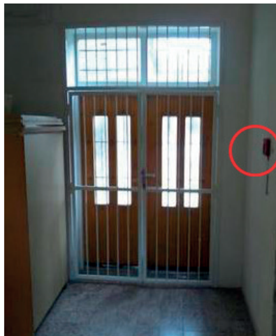
6. kép. Kulcsdoboz a vészkijárat mellett

A vészkijárat könnyű, gyors és akadálytalan nyithatóságát nem tudja biztosítani a csavarral lezárt kétszárnyú vészkijárat ajtó, amely az egyik vizsgált létesítmény sporttermében volt fellelhető (7. kép).