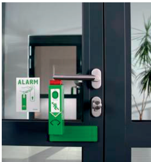
10. kép. Riasztóval felszerelt MSZ EN 179 szerinti vészkijáratú zár [27]

A vészkijáratokhoz utólagosan felszerelhető olyan berendezés, amely a kilincs vagy pánikrúd működtetése esetén helyi akusztikus jelzést ad, ugyanakkor a vészkijárat azonnali használhatóságát nem korlátozza [25] [26]. Megfelelő vizuális jelzések, feliratok és előirasztási funkció alkalmazásával a rendeltetéstől eltérő használat megelőzhető. Ilyen kialakításra mutat példát a 10. és a 11. kép.