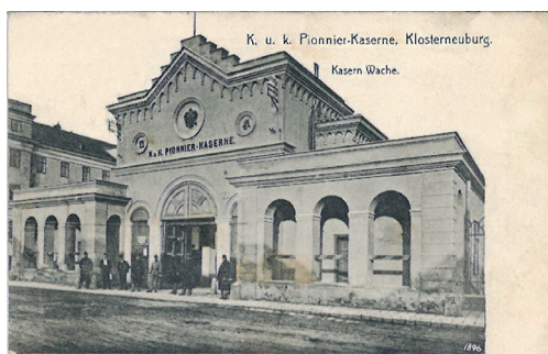
2. kép: Az utászaktanya Klosterneuburgban, 1896-ban

Katonatiszti pályafutását 1903. augusztus 18-án kezdte hadnagyként a császári és királyi 15. utászászlóalj 5. századában, Klosterneuburgban (2. kép).