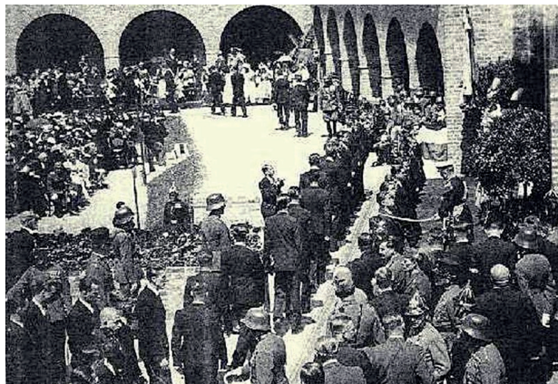
4. kép: A vitézek avatása 1938-ban