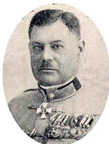
1. kép: Czetz Alfonz vezérőrnagy

Az Osztrák–Magyar Monarchiában két leggyakrabban használt nyelven, magyarul és németül beszélt és írt. Sikeres császári és királyi katonai alreáliskolai és katonai főreáliskolai tanulmányok után a császári és királyi Műszaki Katonai Akadémiát végezte Bécsben. 3