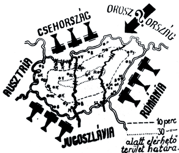
4. kép: Magyarország légi fenyegetettsége a második világháború előtt

a határok fölött az ország belsejébe is. 8 Az újságok beszámoltak a borzalmakról és a szenvedésekről. A polgári lakosság jól tájékozott volt, és a fenyegetettségről alkotott vélemények katonai újságban, egyetemi vagy napilapokban is megjelentek. Később a hazánkhoz közeli események – mint Lengyelország vagy Belgrád bombázása a második világháború során – már közvetlen tapasztalatot szolgáltattak idehaza is. Általános volt a megítélés, hogy „lyukas légtérrel várjuk az ellenséget, miközben észak–déli irányban harminc, kelet–nyugati irányban kilencven perc alatt lehetett átrepülni felettünk” 9 (4. kép).