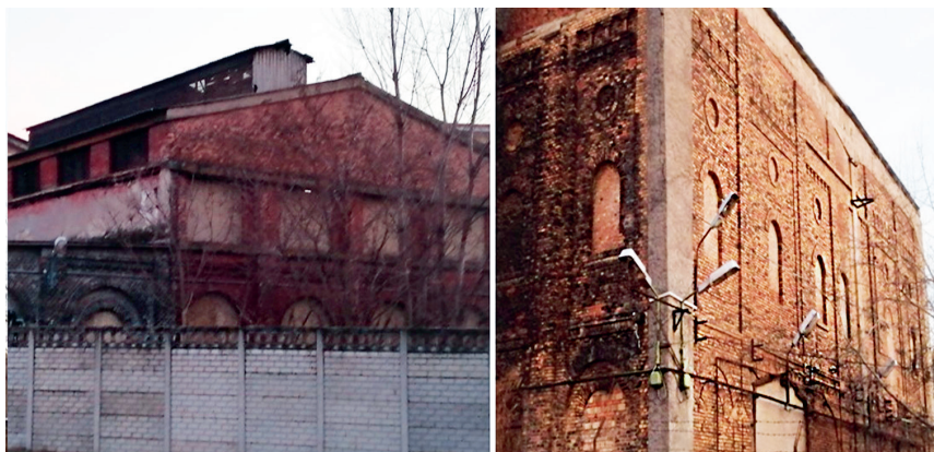
8. kép: Illusztráció elsötétített, éjjel is termelő, üzemekről