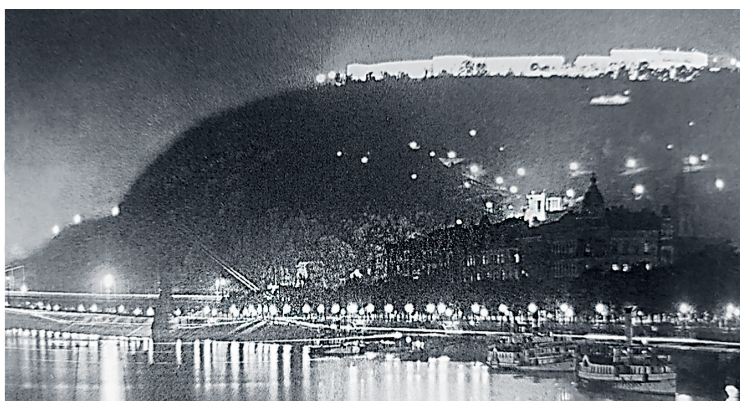
2. kép: Budapest (a Citadella és a Szent Gellért-szobor) díszvilágításban 1929-ben

A megrendelések teljesítése érdekében a kapacitásokat is bővítették. A termelési és az azt kiszolgáló erőforrások fokozása erőteljesebb kooperációt követelt meg a gazdasági szereplőktől. Miközben a háborúban az ország ipari körzetei, infrastruktúrája célponttá váltak, az igények az egekbe szöktek. Ilyen körülmények között a károk és az áldozatok számának csökkentése érdekében hozott elsötétítési intézkedéseket és a biztonságot mint két ellentétes elvet csak az életvédelem mint közös cél volt képes egyesíteni. Ezért a hatékony kivitelezéshez észszerű, racionális, mérnöki megoldásra volt szükség. Még akkor is, ha a gazdasági szereplők és döntéshozók abban voltak érdekeltek, hogy csak annyi fény legyen, ami a termeléshez és a privát élethez ténylegesen nélkülözhetetlen. Olyan korban történt ez, amikor az elektromos világítás már széles körben teret hódított (2. kép).