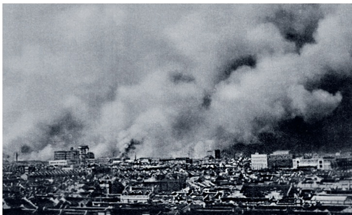
1. kép: Csepel légi bombázása 1941-ben