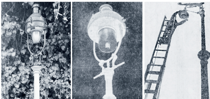
7. kép: Auer-gázlámpa és utcai elsötétítése

Tarkította a képet, hogy ekkor a gáz közvilágítás-célú felhasználása még jelentős volt. Budapesten például a józsefvárosi légszeszgyárból a Lánchídon áthaladó vezeték látta el Budát, ahol 1866-ban létesült gázgyár, és ellátta Óbudát, majd 1913-ra itt szintén gázgyár létesült, amely 1914-ben kezdte el működését és biztosította a gázszolgáltatást 41 Budapesten (7. kép).