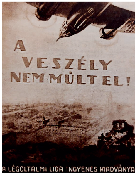
5. kép: A légi veszélyre figyelmeztető plakát (Légoltalmi Liga)

Az új fegyvernem a civil társadalomra veszélyt és szenvedést jelentett. Roosevelt amerikai elnök felszólította a nemzeteket, hogy mondjanak le a légi hadviselésről, és szüntessék be a katonai repülőgépek gyártását. 12 Semmi nem szemlélteti jobban a kialakult gondolkodást, mint Göring német birodalmi tábornagy szavai, amikor „mindenki becsületbeli kötelességének” nevezte a légoltalmat. 13 Idehaza is olvashatták az újságban, hogy az a nemzet, amely a „legfegyvermezettebb, az fogja megnyerni az új világrendért vívott háborút” 14 (5. kép).