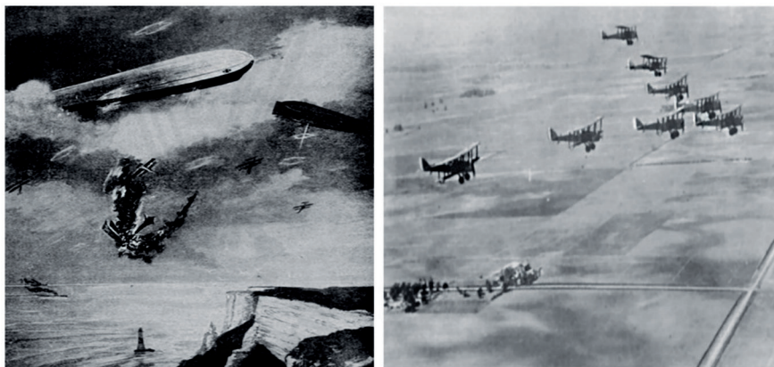
3. kép: Légi csata az első világháborúban

A 20. század puszkaporos hangulata és a hatalmi törekvések, illetve a technológiai fejlődés eredményeként az újszerű fegyverek megjelenése, illetve Európában a század elején bekövetkezett világhégés egyaránt rányomta bélyegét a hadi gondolkodásra, aminek a célja az állóháború, valamint az addig tapasztalt szörnyűségek elkerülése volt. Az újonnan megjelenő harci eszközök megfelelő kilátást nyújtottak, és olyan stratégiával kecsegtettek, amely végső soron az elsötétítés elméletéhez és gyakorlatához vezetett. Kialakulásának gyökereit az aviatikával kapcsolatos nemzeti érzésekben kell keresnünk, mivel annak ellenére, hogy az első világháború előtt nemzeti becsben tartották a német Zeppelineket és az antant oldalán a repülőgépeket, a háború kitörésekor újszerűen hatott a légitámadás. Az első elsötétítési intézkedés Winston Churchillhez köthető, aki a német tengeralattjárók elleni védekezés felkészülése érdekében, az admirális első lordjaként gyakorlatot hajtatott végre még 1913-ban. A városok részéről nem voltak védelmi előkészületek. 1914-ben bevezették a briteknél az első elsötétítési rendelkezéseket. 2 A légitámadások során a bevetett egységekre már az első világháborúban is komoly veszélyt jelentettek a nappali légvédelmi ütegek, miattuk kényszerültek taktikai váltásra a hadakozó felek (3. kép).