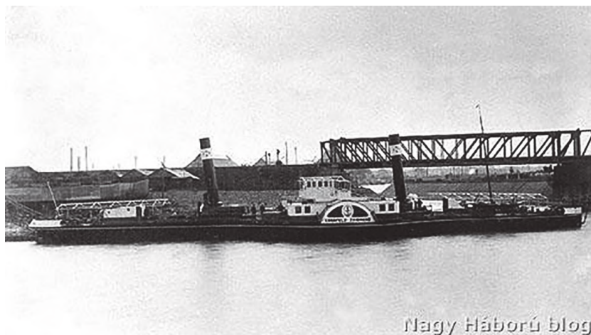
3. ábra. A Kornfeld Zsigmond gőzös