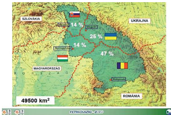
2. ábra. A Felső-Tisza vízgyűjtőjének országok közötti megoszlása