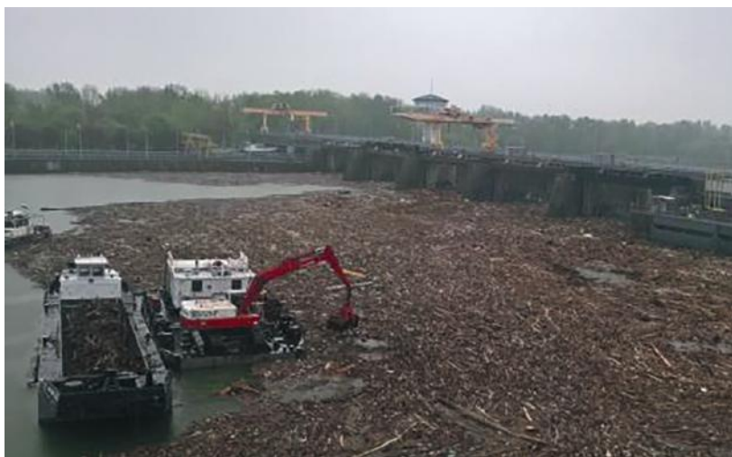
5. ábra. Az uszadék és hulladék kiemelése

Az 1990-es évek végétől – főként a PET-palackok megjelenésével – már számottevő mennyiségű hulladék érkezett az árhullámok kíséretében. Ezt – különös tekintettel az előző fejezetben hivatkozott jogszabályokra, illetve azok előzményeire – az 5. ábrán szemléltetett módszerrel ki kell emelni a vízből és partra szállítva kezelni kell.