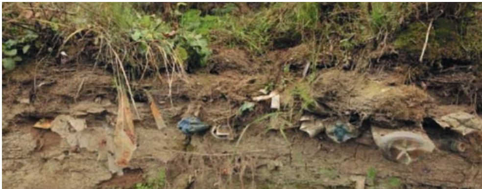
7. ábra. Lerakódott, beiszapolódott, növényzettel benőtt hulladék