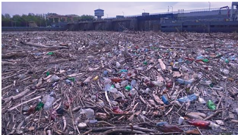
4. ábra. A Kiskörei Vízlépcső az érkező uszadéknek és hulladéknak is mesterséges gátját képezi