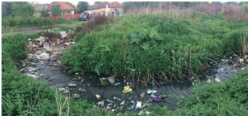
3. ábra. Kisvízfolyás kommunális hulladékszennyezése Ukrajnában

Romániában, mind Ukrajnában napjainkban is tapasztalható jelenség, hogy a hulladéklerakókat folyómedrek közelében, esetenként a hullámtéren alakították ki, de gyakori eset, hogy a folyó menti településeken egyszerűen a vízbe borítják a hulladékot. A 3. ábrán látható, általánosnak nevezhető állapotok miatt az utóbbi években a felső-tiszai vízgyűjtőkről évente mintegy 3500 tonna hulladék érkezik a folyón Magyarországra területére.