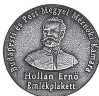
4. ábra. A kiemelkedő mérnöki, valamint a mérnöki kamarai tevékenységért 2003-ban alapított elismerés, a Hollán Ernő-emléklap