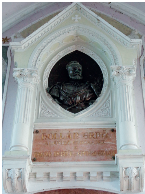
3. ábra. Hollán Ernő síremléke Békáson