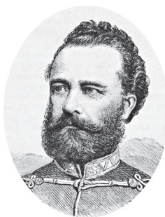
1. ábra. Hollán Ernő honvédelmi államtitkár, 1870

Keywords: fortification, improvement of railway network, military science