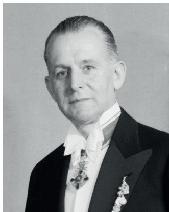
1. ábra. Oskar Regele 1950-ben