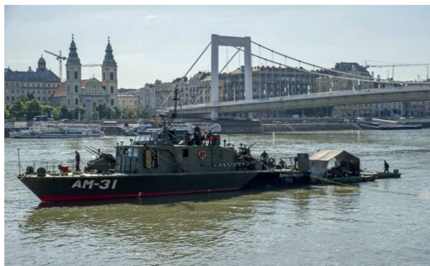
3. ábra. Bombakiemelés az Erzsébet-híd közelében – 2018. július

2018 júliusában éppen egy ilyen helyszínen kellett helytállni a MH 1. Honvéd Tűzserész és Hadihajós Ezred katonáinak. Budapest szívében, az Erzsébet-híd közelében kellett felkutatni, azonosítani, kiemelni, hatástalanítani és elszállítani egy feltételezett robbanótestet. Az alakulat katonái – ide értve a hadihajós, a bűvár és a tűzserész-szakállományt – két nap alatt elvégezték a veszélyes feladatot.