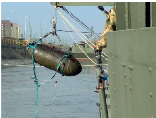
5. ábra. GP–2000 amerikai légibomba kiemelése – 2019. március

A Dunára jellemző viszonyok között a korábban felderített eszközök kiemelése rendben megtörtént. Az azonosítás során kiderült, hogy mindkettőben M103 típusú orrgyújtó volt, valamint az egyikben M102 típusú fenékgyújtó. Mindhárom szerkezetet sikeresen eltávolították a szakemberek, majd mindent elszállítottak későbbi megsemmisítés céljából.