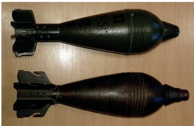
2. ábra. O–832D és O–832 aknagránátok

A 2. ábrán látható, hogy az eltérő gyújtószerkezeteken 16 kívül szembeötlő a különbség a stabilizátorrészekben. A régebbi változat szárnyai áttöretesek, és végigérnek a stabilizátorrészen. Az áttöret a kiegészítő lőportöltet 17 rögzítésére szolgál. Az újabb típusnál már rövidebbek a szárnyak, és nincs rajtuk áttöret. Ennél a változatnál a kiegészítő lőporkorongok a szárnyak fölött, végig a stabilizátorrészen helyezhetők el. Ezek a második világháborúban alkalmazott változatok.