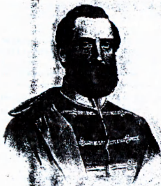
Forradalmi korszak: Lázár Vilmos portréja.