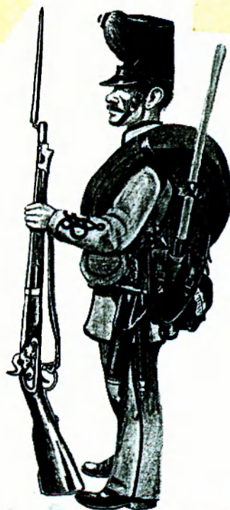
Honvéd utász, aki szintén az osztrák Pionier-ok színeit hordja

Az atillán hat pár zsinórt viseltek az összegomboláshoz. Mindkét ujján vitézkötés volt felvarrva. A zsinórzat szintén fűzőld színű volt a ruhákon. Az utász honvédtisztek atillája díszesebb volt, mint a közkatonáké. A díszöltözet aranyzsinóros volt. A tisztek a táborig atillán zöld zsinórt viseltek, de előfordult piros zsinóros atilla is (viselője valószínűleg altisztból lépett elő). A tisztek öltözkééhez tartozott még a panyókás sapka és a szürke szőrmés bekecs, valamint a táborig öv. Ezt egészítette ki a pantalló a cipővel, vagy a lovaglónadrág a csizmával. A tisztek csákója szintén fekete színű volt.