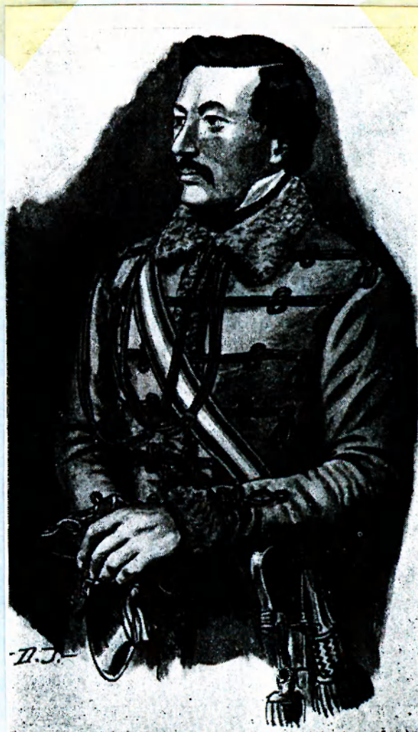
Utász hadnagy a Honvéd Múzeum fenykepe után