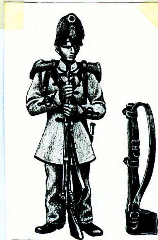
Honvéd árkász, egyenruhájának csukaszürke és meggyvörös színe megegyezik az osztrák árkászöltözettel

Öltözetük megegyezett a honvéd utászok ruházatával, de az ékitmények (zsinórzat, rendfokozati jelvények) sötétvörös színűek voltak. Ez sem lehetett véletlen, hiszen az osztrák árkászok meggyszínű hajtókat viseltek. A honvédségnél is megalakult egy műszaki tisztekből álló magasabb testület, amelyet hol "Várnokkarnak", hol "Mérnökkarnak" neveztek. A várak műszaki felügyeletét egy-egy "hadtéri mérnökkari igazgató", vagy másképpen "mérnökkari igazgató" látta el, törzstiszti rangban. Ezek a magasrangú tisztek voltak a helyőrségi árkászosztagok előljárói, ezért ennek a csapatnak az egyenruháját hordták ők is, sötétvörös hajtókéval.