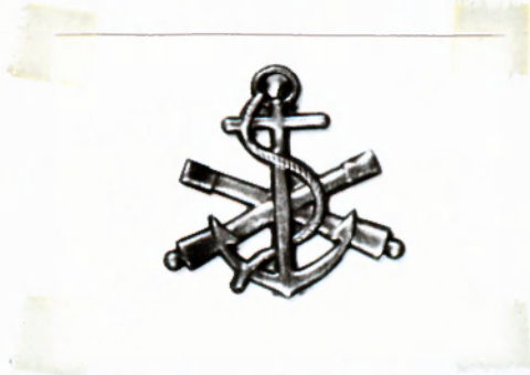
6.számú ábra: Flottilla fegyvernemi jelvénye, 1945.

Nagyon ritka! Gyűjteményembe található egy-egy darab tiszti, tiszthelyettesi jelvény, mely csere útján került hozzám 1986-ban. Viselésüket 1947-ben megszüntették, azonban 1949-ig engedélyezték a tovább hordásukat - hiszen az újabb típust csak akkor rendszeresítették.