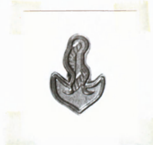
9.számú ábra: 1967M fegyvernemi jelvény

Méretei: azonosak a 7., 8. ábránál leírtakkal, eltérés, hogy nincs rajtuk tűzzománc díszítés.