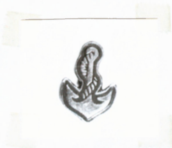
8.számú ábra: 1957M fegyvernemi jelvény

Nagyon ritka jelvény! Ennek a típusnak a viselését a honvédelmi miniszter 1966. december 31-el megtiltotta. Ünnepi öltözethez a tiszti, tiszthelyettesi állomány hímzett, fémszálból készült fegyvernemi jelvényt viselt 1952-1957 között.