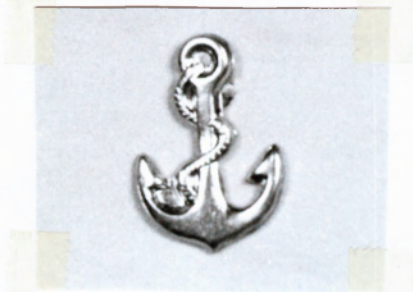
7.számú ábra: Flottilla 1949M fegyvernemi jelvénye

Méretei: 16x11,5 mm. vastagsága: 0,2 mm, tömege: 0,3 gramm.