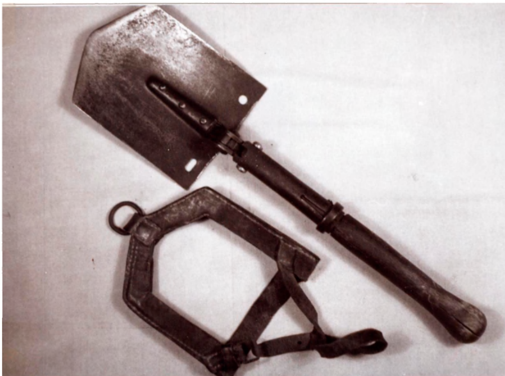
1. számú ábra: Német gyalogsági ásó hord helyzetben