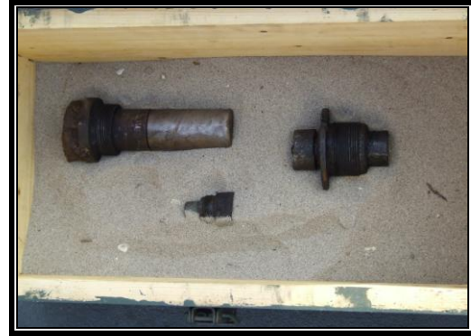
5. ábra: Egy 62 év után hatástalanított GP 500-as ép gyújtószerkezetei 6

A helyi polgári védelmi szervezetek és a polgármesteri hivatal dolgozói közben mindent megtettek a kitelepítettek ellátása érdekében.