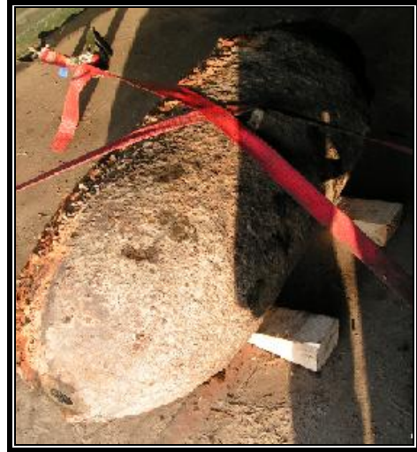
8. ábra: A szállításhoz előkészített bomba 9

Óriási rombolóereje van az ilyen típusú bombának, ötszáz méteres körzetben mindent "megmozdított" volna, ha felrobban az ilyen típus attól igazán veszélyes, hogy két gyújtószerkezete is van. Arra tervezték, hogy nem közvetlenül a házat rombolja le, hanem robbanásával megrázza a házak alapját, ami miatt az épületek összedőlnek, leborulnak.