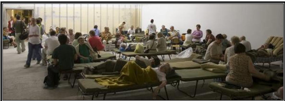
6. ábra: A kitelepített lakosság egyik ideiglenes szálláshelye 7

A lakók minden értéküket, minden ingó- és ingatlan vagyonukat hátrahagyva, vagy épp a munkából hazafelé menet voltak kénytelenek menekülni otthonaiktól az ideiglenes szálláshelyek felé.