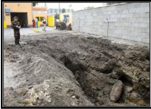
4. ábra: Az 500 kg-os bomba elhelyezkedése 5