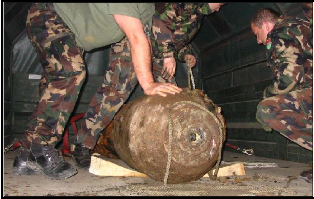
9. ábra: A fargyújtó nélküli bomba, szállításra készítés közben 10