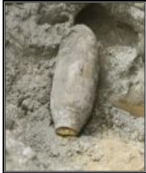
2. ábra: A talált bomba első rögzített felvétele 3

A kiürítésben a kerületi járőrök mellett segítséget nyújtottak a polgári védelem és a katasztrófavédelem munkatársai, valamint a Készenléti Rendőrség emberei. Az evakuálás becslések szerint több ezer embert érintett. Az 1.Honvéd Tűzszerész és Hadihajós Zászlóalj tűzszerészei csak a kiürítés után foghattak munkához. A bomba a MÁV közlekedését nem befolyásolta, Rákos-rendezőtől körülbelül 600 méterre találták ugyanis a robbanószerkezetet. A BKV-nak két buszjáratát érinti a lezárás, a 20-as gyors és a 30-as buszok kerülő úton közlekedtek.