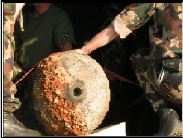
7. ábra: Az orr gyújtó nélküli GP 500-as 8