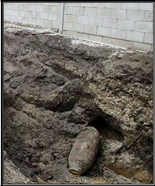
1. ábra: GP 500 romboló bomba 2