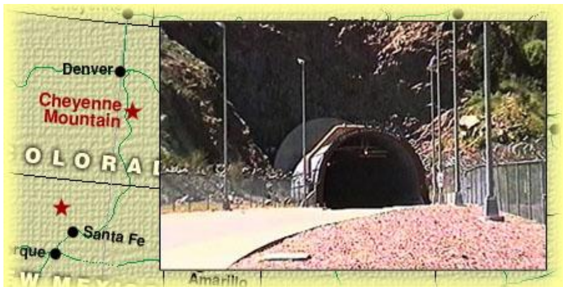
1. számú ábra A Komplexum bejárata

De nem csak a NORAD és a Space Command található itt. A CMC keretein belül az alábbi rakéta-, atmoszféra- és űrfigyelő rendszerek kaptak helyet: