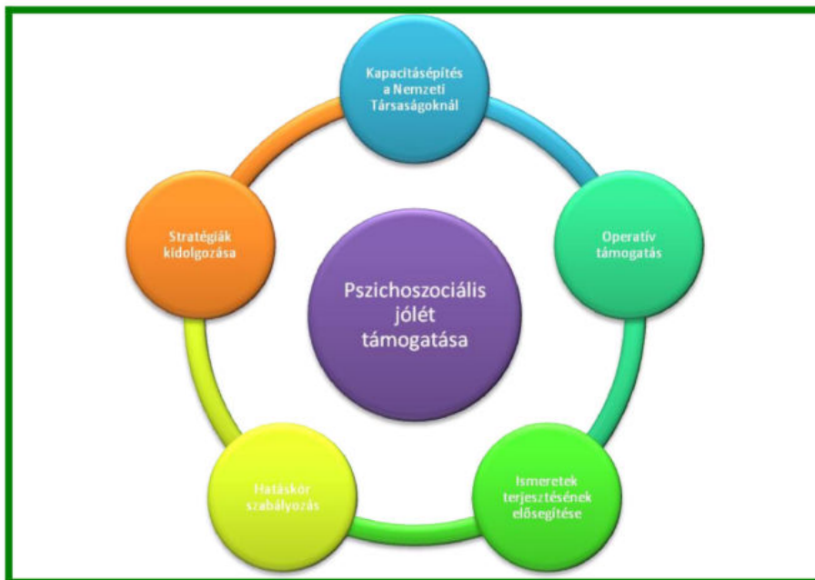
3. sz. ábra

A Pszichológiai Támogatásért Felelős Központ alapvető és kiegészítő feladatai