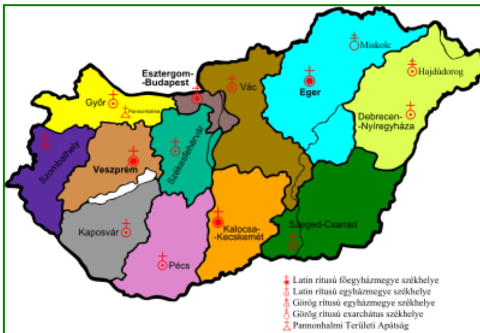
2. sz. ábra: Katolikus egyházkerületek Magyarországon

Az egyház fő feladatai közé tartozik a kezelésében lévő egészségügyi-, szociális- és oktatási intézmények fenntartása. Ezen túl, működteti a Katolikus Karitást, mely szervezet családsegítő és gyermekjóléti szolgálatot, házi szakápoló szolgálatot, szenvedélybeteg segítő szolgálatot, és idősoththonokat tart fenn, és tevékeny részt vállalt például a 2010. évi borsodi árvíz kárfelszámolási feladataiban is. Részt vettek azon ingatlanok helyreállításában, amelyek károsodtak. Építészeik révén részt vettek a kárfelmérésben, az építőipari tevékenységben, az ingó dolgok beszerzésében.