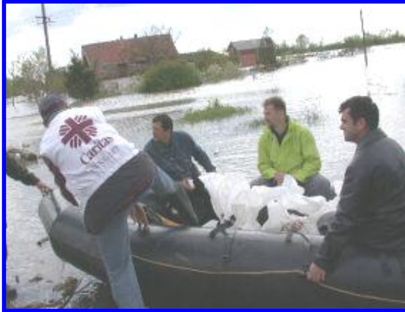
5. sz. ábra: Katolikus Karitás segélyszervet mentés közben