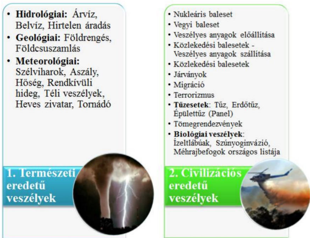
4. ábra: A katasztrófák csoportosítása [2][15] (saját szerkesztés)

Az új kihívások tekintetében további feladatokat is kiemelhetnék, azonban erre ebben a cikkben nincs lehetőség. A fejezet befejezéseként szemléltetem, hogy milyen eredetű lehetséges katasztrófatípusokkal és veszélyekkel találkozhatjuk szemben magunkat napjainkban.