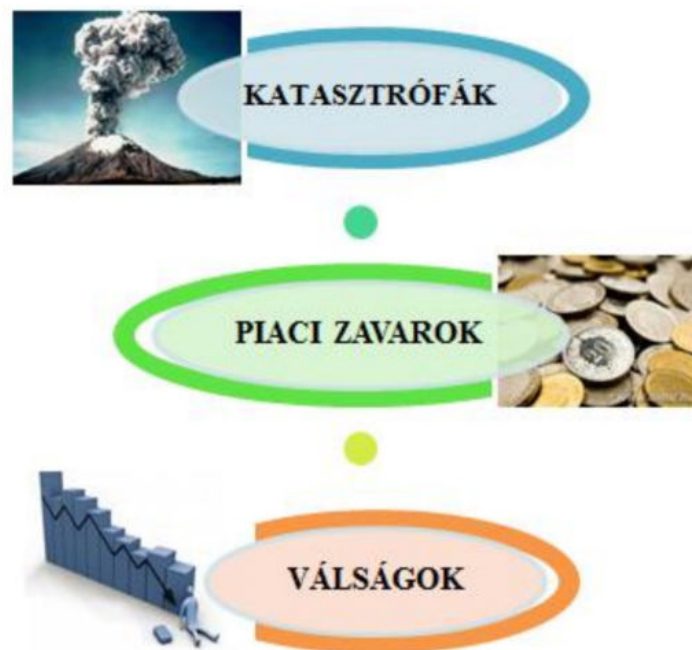
5. ábra: A gazdasági koncepció megalkotásának lényege [4] (saját szerkesztés)

A komplex védelmi rendszer következő alrendszere a nemzetgazdaságot foglalja magában [16]. A nemzetgazdasági kérdéskör fontosságára többek között az előző fejezetekben taglalt feladatok hívták fel a figyelmet. A különféle válságkezeléseknél a felkészülés fázisát erősíteni kell, ennek érdekében szükségessé vált egy hosszú távú koncepció megalkotása, amely egy átfogó gazdaságbiztonsági rendszer kialakítását foglalja magában [4]. A dokumentum megalkotásának célja, hogy a gazdaság megfelelően működjön az alábbi esetek bármelyikének előfordulása esetén: