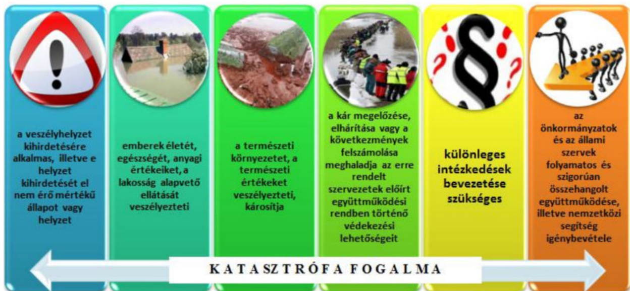
1. ábra: A katasztrófa fogalmának alkotóelemei [6] 4 (saját szerkesztés)

A katasztrófa fogalmát az alábbi alkotóelemek adják össze: