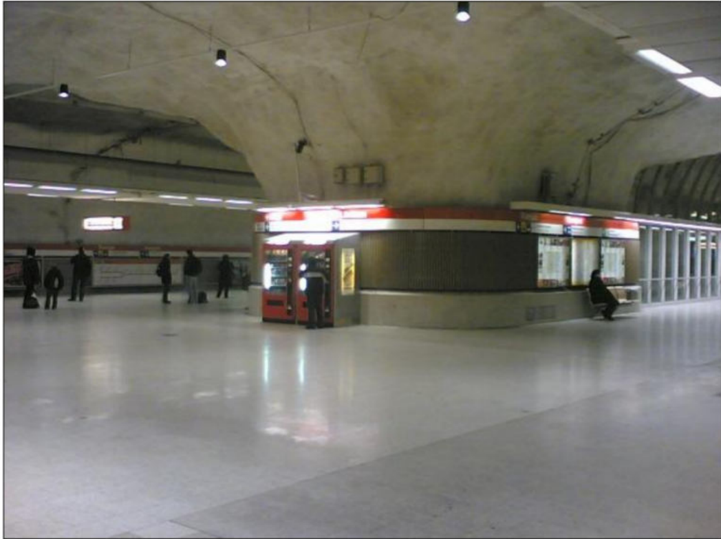
4. ábra: Helsinkii kettős rendeltetésű metróállomás