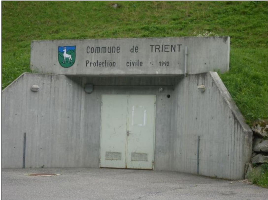
3. ábra: Helyi, nukleáris támadás elleni óvóhely Svájcban

vonatkozásban is képes volt elszigetelődni és semleges maradni a többi államtól. Szuverenitásán – mint legfőbb erényén – felül nagy hangsúlyt fektet a lakosság védelmére, biztonságának megőrzésére. Évente több alkalommal is végez a lakosság polgári védelmi gyakorlatot és az oktatásügyben is fontos tényezőként jelenik meg az előzetes védelmi felkészítés. [11]