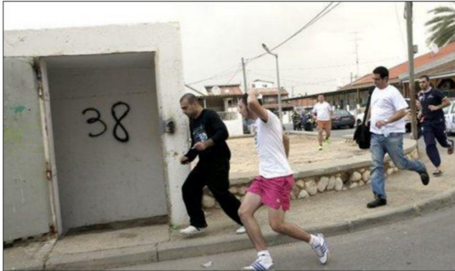
5. ábra: Izraelben történt légvédelmi riasztás pillanatai

kialakításra, amelyek közül egyet a 6. ábra illusztrál. Az ott élő gyerekek már hozzászoktak a meneküléshez, a mindennapi életük részévé vált.