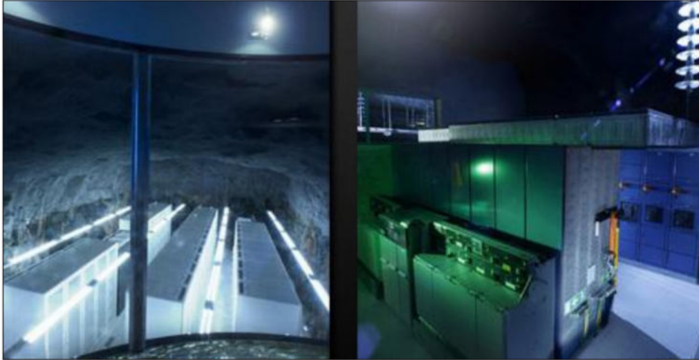
7. ábra: Balaton alatti Luxusbunker képei (NASA)

A világ egyik legnagyobb űrhajózási hivatala a NASA már évek óta létesít különböző – arra alkalmas helyeken – földalatti bunkereket, óvóhelyeket. Magyarországon az e célra tökéletesen alkalmas földréteget a Balaton alatt találták meg, ahol időközben teljes titokban épült fel a 7 emeletes luxusbunker, amelyről egy 5013 oldalas dokumentum árulkodik. A helyszín Siófoktól bejárata Siófoktól 11km-re található és a legnagyobb része a Balaton alatt terül el. Az épület ellenáll a legerősebb földrengésnek és bármilyen külső behatást, becsapódást meggátol. Befogadóképessége közel 65.000 fő. Az épületben elhelyezésre került több üzlethelyiség, mozi, kaszinó, étterem és uszoda is.