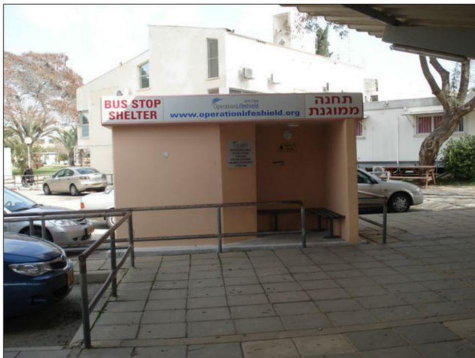
6. ábra: Egy Izraelben lévő óvóhely rendeltetésű buszmegálló Forrás: http://www.jewishatlanta.org/page.aspx?id=169994 (2013. 04. 28)

Egyre többen – akik eddig még nem tették meg – pincéjükből, raktáraikból is óvóhely-szerű védőlevesítményt igyekeznek kialakítani és minél több szükséges élelmiszert felhalmozni. Izraelben már működésbe lépett egy figyelmeztető célzatú, az egész országra kiterjedő sms-riasztási rendszer. A kiküldött üzenetek héber, arab, angol és orosz nyelven íródnak, így az emberek értesülhetnek majd arról, hogy készülniük kell-e rakétatámadásra Irán felől. A napokban került az izraeli felhasználók elé az az okostelefon-alkalmazás, amely egy rakétatámadás során a telefon használóját tájékoztatja a hozzá legközelebb eső óvóhelyről