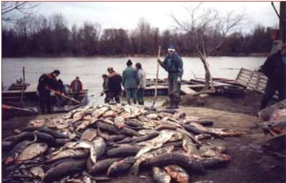
4. kép:Tíz éve történt a Tiszai cián katasztrófa[15]

Hazánk történetének legnagyobb ipari katasztrófája következett be 2010. október 04-én, amikor a MAL Zrt. Ajkai Timföldgyára 10-es zagytározójának gátja átszakadt és az abból kiömlő lúgos iszap elöntötte Kolontár, Devecser és Somlóvásárhely jelentős részét. Ezzel az anyag bekerült az ott található Torna-patakba, a Marcal, a Rába és a Duna folyókba is. A tragédia során 10 ember meghalt és több mint 150 fő sérült meg.