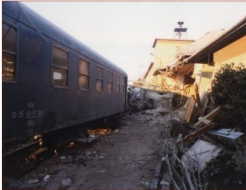
2. kép: Vasúti balesetek [9]

tolatás és a katasztrófa előtt áthaladó személyvonat után a váltókat újra kellett volna állítani. Mindezekért a büntetőeljárás során a bíróság halálos tömegszerencsétlenséget okozó vasúti közlekedés gondatlan veszélyeztetése miatt a váltókezelőt, a tolatásvezetőt, valamint szolgálattelvőt is szabadságvesztésre ítélte. Emellett természetesen a büntetőeljárást követő kártérítési eljárás során a MÁV a hozzátartozók részére hatalmas kártérítési összegeket volt köteles megtéríteni[8].