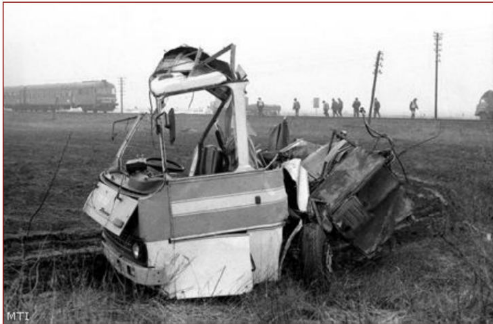
1. kép: 1993: Mi lesz most?! Itt a vonat![7]

cselekedetével a mozdony vezetője halálos tömegszerencsétlenséget okozó közúti balesetet okozott és büntetésként szabadságvesztésre ítélték[6].