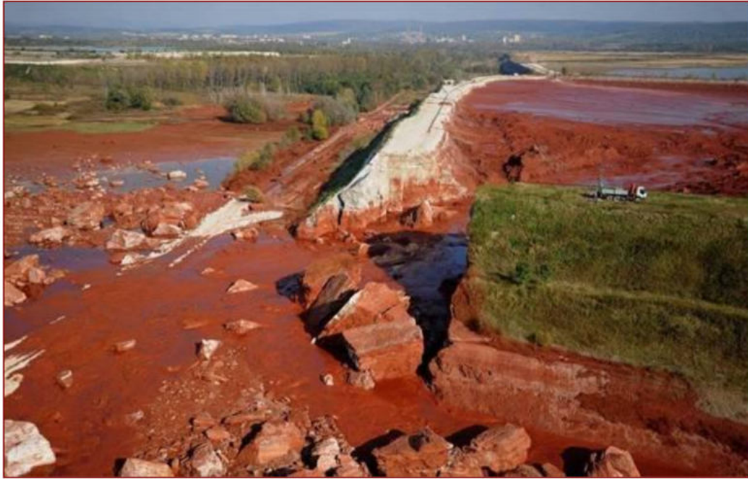
5. kép: Összefoglaló a vörösiszap-katasztrófa elhárításáról, a kármentesítésről és a teendőkről [17]