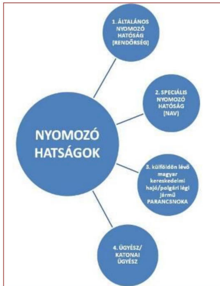
1. ábra: A nyomozó hatóságok bemutatása 1

A nyomozó hatóságokat az alábbi ábra szemlélteti részletesen.