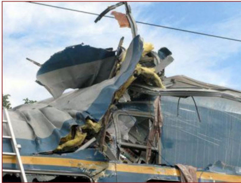
3. kép: Monorierdő, vonatbaleset, 2008. [11]

Végül pedig az általam bemutatni kívánt katasztrófák közül az utolsó a 2003. május 08-án, Siófokon történt autóbusz baleset , melynek során a Budapest-Nagykanizsa felé tartó gyorsvonat elgázolt egy német turistákat szállító buszt. Ennek során, a buszon utazó 33 fő vesztette életét, és 6 fő sérült meg. Ebben az esetben is a busz vezetője volt felelős a balesetért, hiszen úgy haladt át a kereszteződésen, hogy a fényjelzést figyelmen kívül hagyta, ezért a közúti közlekedés szabályainak megszegésével halálos tömegszerencsétlenséget okozó közúti veszélyeztetés büntetést követte el [12].