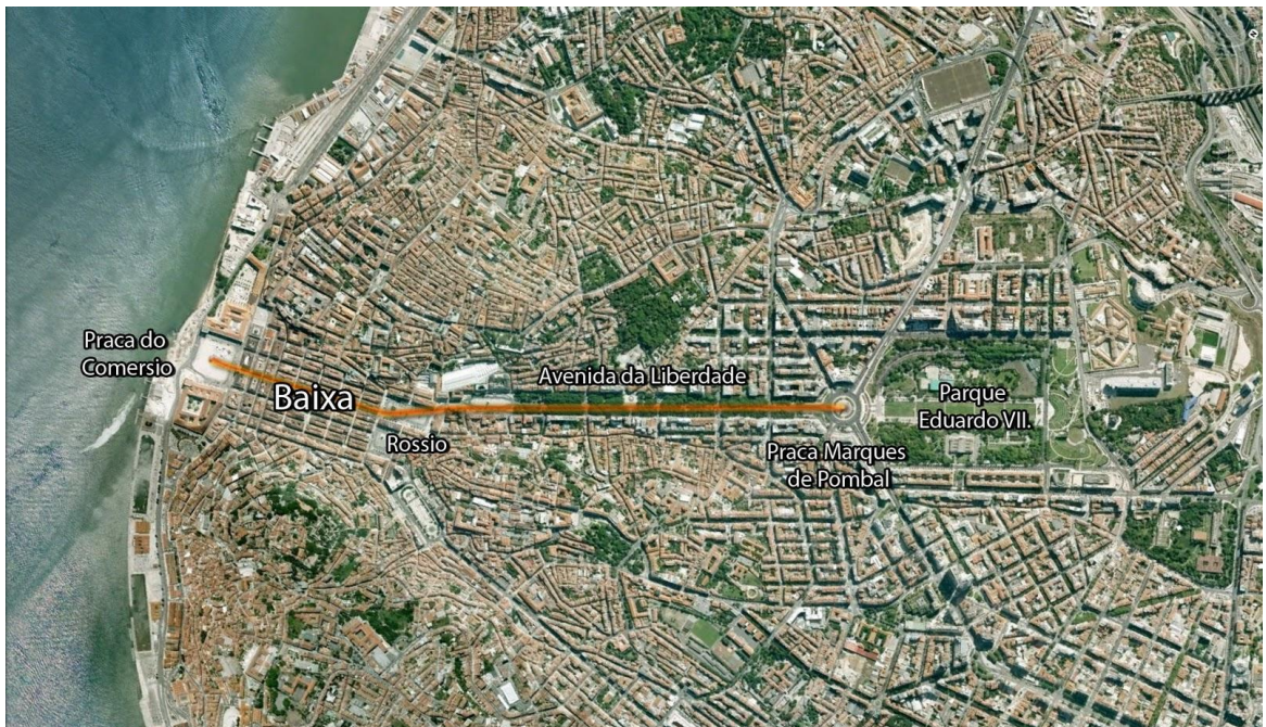
A mai Lisszabon-Baixa negyed 32

A modern várostervezés egyik klasszikus példája Lisszabon, a Baixa városnegyed modern sakktabla alaprajz szerint, tudatosan tervezték meg és építették újjá.