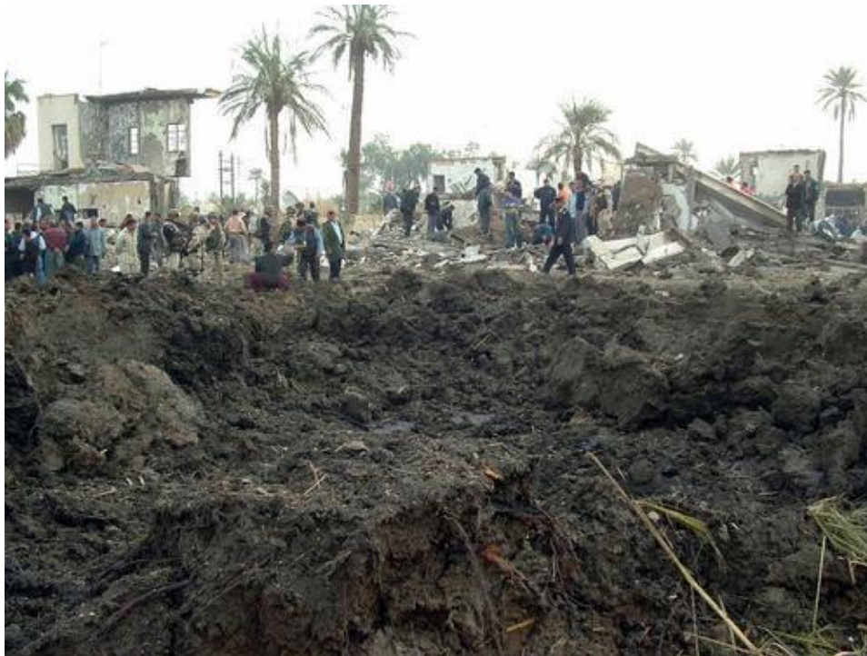
1. sz. kép: A tábor elleni robbantás epicentruma 10