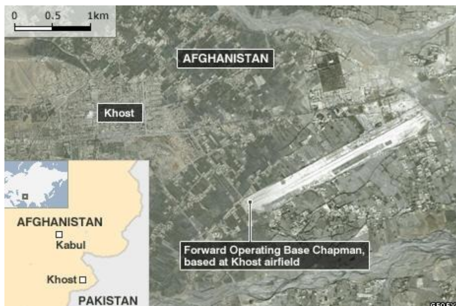
3. sz. kép: Az amerikai bázis helye légi fényképen 20

Az esettel kapcsolatban jogosan merül fel több kérdés is, amelyek rávilágítanak a tábor biztonsági rendszere kialakítása és működtetése hiányosságaira: