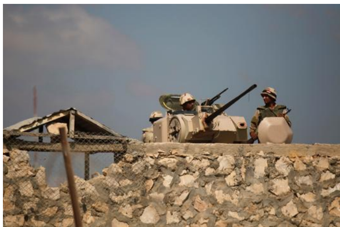
5. sz. kép: katonai tábor védelmének megerősítése gyalogsági harcjárművel 24

2013 júniusában lázadók támadták meg a kabuli nemzetközi repülőtér katonai részét, amelyben a NATO helyi főhadiszállása is van. Robbanások és lövések hallatszottak az afgán hadsereg és a rendőrség beszámolója szerint. A tálibok jelentkeztek a támadás elkövetőjeként. A kabuli rendőrség parancsnokhelyettese azt mondta, hogy hét felkelő támadta meg a repteret. Kettlen működésbe hozták a testükre erősített robbanószerkezetet, öt társuk pedig elfoglalt egy magas épületet a repülőtér nyugati, polgári felén, és onnan lőtte a reptér katonai részét. Legalább egy nagy robbanás történt, majd tűzharc kezdődött a biztonsági erőkkel, akik végeztek a támadókkal. 23