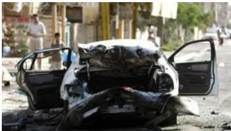
4. sz. kép: Látkép utcai robbantásos merénylet után 21

2012 elején hat afgán civil életét vesztette egy öngyilkos pokolgépes merényletben a dél-afganisztáni Kandahár repülőterének bejáratánál. A merénylet elkövetését a tálibok vállalták magukra. A célpont „a külföldi erők egy páncélozott járműve” volt.