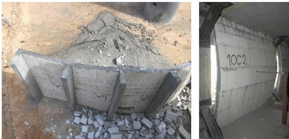
5. ábra. Merevítő bordákkal megerősített, valamint blokkos falszerkezetek 12

A falszerkezet mellett különösen fontos a tartó (váz-) szerkezet megerősítése. Az általánosan használt vasbeton tartóoszlopok ellenálló képessége növelhető például a szénszálalás műanyagok használatával, amely a merev szerkezetet a fellépő erőhatásokkal szemben sokkal rugalmasabbá teszi. A katonai rendeltetésű ideiglenes épületek védelmére szolgálhatnak a rugalmas, a lökéshullámnak és a keletkező nyomásnak ellenálló, az erőhatásokat csillapító, blokkokból készített falszerkezetek.