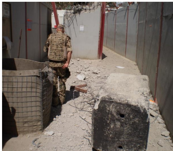
7. ábra. Az egyik forgalomterelő kötömb 15

Az épületek védelme mellett nem szabad elfeledkeznünk a létesítmény „külső” védelmét biztosító kerítés, valamint a bejáratok megfelelő kialakításáról sem. A Kabulban települt ISAF Parancsnokságot például már több esetben is érte robbantásos támadás, legutóbb 2011. augusztusban, amikor a bejáratról 15 méterre történt a detonáció. A robbanás olyan erejű volt, hogy két darab, egyenként 1 tonnás, forgalomterelő elemként elhelyezett kötömböt egyszerűen „átdobott” a bázis kerítésén!