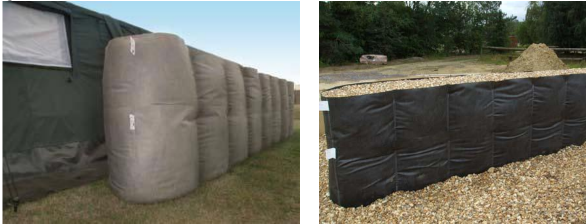
3. ábra. DEFENCELL modulok alkalmazási lehetőségei 10

azonban nem szabad elfelejteni a személyek ellenőrzésének, valamint a robbanószerkezet észlelésének, felfedésének fontosságáról sem! Erre alkalmazhatók a különböző röntgenberendezések, a milliméteres hullámhosszúságon működő szkennerok, amelyek a ruházaton is „átlátnak”, valamint a gázkromatográfiás berendezések, melyek a levegőből vett „szagmintával” képesek az ellenőrzésre.