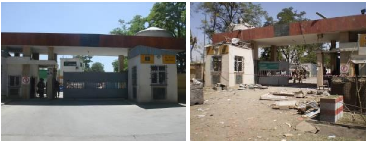
4. ábra. ISAF Parancsnokság bejárata a robbanás előtt és után [6]

A VBIED által okozott károk az alábbi ábrán is jól láthatók. A robbanás olyan erejű volt, hogy két, egyenként 1 tonnás, forgalomterelő elemként elhelyezett kötömböt egyszerűen „átdobott” a bázis kerítésén!