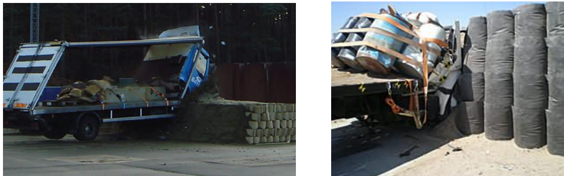
3. ábra. DEFENCELL elemek tesztelése járművekkel [4]

A T4 hatékony védelmet nyújt a lőfegyverek (25,0 mm), aknavetők közvetlen találata, illetve a járműre szerelt improvizált robbanószerkezetek (VBIED) ellen is. A feltöltés meggyorsítása érdekében telepítő keret alkalmazható, a készlet kézi erővel és géppel is feltölthető.