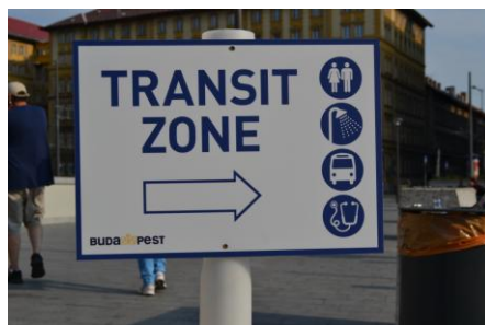
5. ábra Piktogram a Keleti pályaudvarnál (a szerző felvétele)

Számos esetben az úton levők csak nagyon nehezen, vagy egyáltalán nem írnak vagy olvasnak még csak a saját anyanyelvükön sem. Mindezen okoknál fogva a tábor üzemeltetőinek gondoskodnia kell arról, hogy a különböző funkciók, protokollok, ellátási lehetőségek olyan piktogramokkal is ábrázolásra kerüljenek, amelyeket a táborlakók megértenek és saját érdekében követni is tudnak. A megfelelő módon elhelyezett és használt útmutatók, tájékoztatók nagymértékben könnyítik a tábor üzemeltetőinek a feladatát.