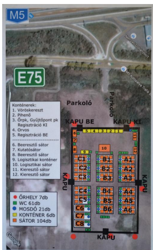
6. ábra Körletek a röszei táborban – Csongrád megyei Rendőrkapitányság vázrajza

A tábor ezen elrendezése is már egy bizonyos fokú tagoltságot mutat, ugyanakkor a nagyobb biztonság érdekében szükséges a külön övezeteket is tovább tagolni. A tábor fragmentumok kialakítása különösen fontos a szállás övezeteken belül.