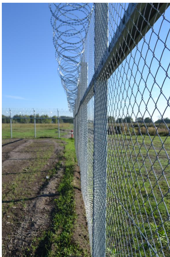
1. ábra Röszkei befogadó tábor kerítése

A nyugat-európai menekültvárást 3 a kölni, berlini és düsseldorfi eseményeket követően nagyfokú kijózanodás követte. A szélsőjobboldali szervezetek főleg a skandináv államokban és Németországban megerősödtek, az államaik által a saját lakosságot védő és érintő óvintézkedések hiányát maguk szerették volna kézbe venni, ezért számos befogadó hely ellen intéztek támadásokat radikális szervezetek. 4 Ezeknek a támadásoknak véttlen elszennvedői, azok a valós menedékkérők, akik korábban a szélsőséges iszlám, vagy a dzsihadista erőszaknak is elszennvedői voltak. Az aktuális európai helyzetet nem elemezve, csak a híradásokat és statisztikai adatokat számba véve tapasztalható, hogy Európa nyugati felén a radikális szervezetek és azok követőinek a száma jelentősen megnőtt. Mindezen okoknál fogva a táborok fenntartói- és üzemeltetőinek feladata a táborok külső védelmének a megszervezése és fenntartása.