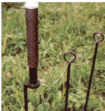
2. ábra Botlódrótos jelzőrakéta [4 – 212. o.]

A kerítések mellett további mechanikai védelmi rendszerek felállítására van lehetőség, ilyen lehet a gyors telepítésű drótkadály (GYODA) alkalmazása, vagy egyéb olyan mechanikus indítású jelzőrendszerek, jelzőtöltetek [4], amelyek a biztonsági szolgálat figyelmét felhívja az esetleges védelmet veszélyeztető helyzetekre.