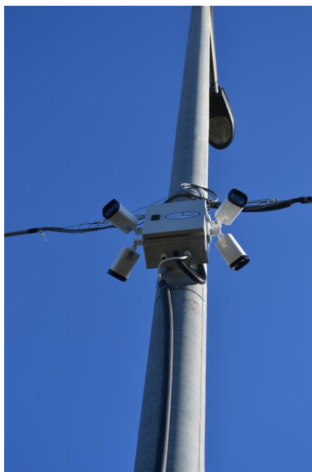
3. ábra Kamerák a röszkéi befogadó ponton

Legújabbban nagyon elterjedtek a különböző elektronikai jelzőrendszerek, ezek lehetnek optikai vagy elektromágneses alapúak. Mindegyik rendszer lényege, hogy áramkör megszakítása, vagy zárása esetén jelezz, hogy illetéktelen behatolás, illetve eltávozás történt a tábor területéről. Ebbe a családba tartoznak a különböző infra mozgásérzékelők, a rezgésérzékelők, a különböző lépésérzékelők, amelyek lehetnek folyadékalapú, vagy optikai fénytöréssel alapuló jelzőrendszerek.