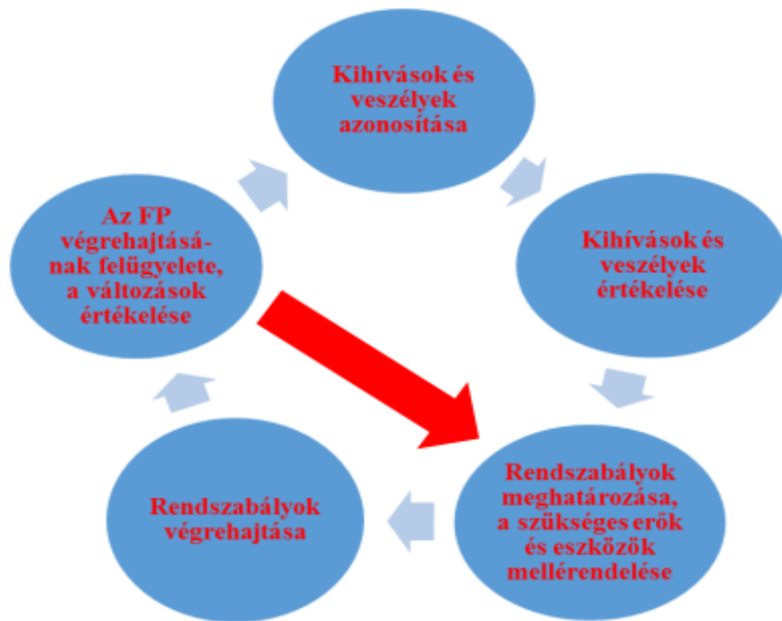
1. ábra: Az FP feladatainak kezelése 67

álló kapacitások alkalmazásának összehangolása is lehetővé válik. Ugyanakkor fontos, hogy a változásokra adandó válaszok időbelisége is biztosítható. Az erők megóvásával kapcsolatos feladatok kezelését az alábbi ábrával lehet szemléltetni: