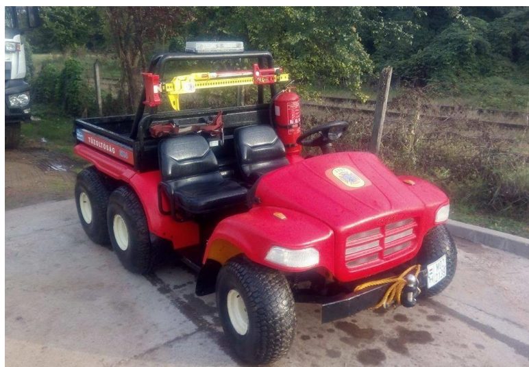
2. ábra Egy Hi-Lift FR-485 a Fábian ÖTE/Málhás-on elhelyezve, Forrás: Kós György

Az eszköz egy magyarországi alkalmazására jó lehetőség az önkéntes tűzoltó egyesületek, ahol az egyszerű kis karbantartási igényű mentőeszközök költséghatékonyan tudják segíteni a beavatkozó képesség fenntartását. Jó példa erre a Fábiansebestyényi Önkéntes Tűzoltó Egyesület (Fábian ÖTE) általi készenlétbe helyezés (2. ábra).