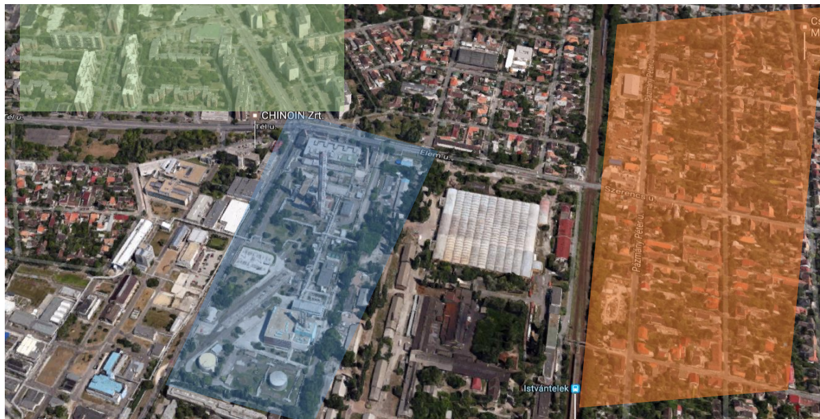
1. ábra: Chinoin gyár és vonzáskörzete [2]

Az üzemek telepítésének elvét, elsődleges szempontjait az Athéni Charta (Modern Építészet Nemzetközi Kongresszusa 1928-1959, IV. kongresszus: 1933 Athén, Görögország) határozta meg, amely szerint az ipari szektornak függetlennek kell lennie lakó övezetektől, amelyektől