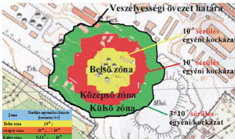
2. ábra: Veszélyes anyagokkal foglalkozó üzem veszélyességi övezete [4]

A lefuttatott szimulációk veszélyességi övezet eredményei a pl. dwg formátumú alaptérképeken tovább szerkeszthetővé válnának. A különböző zónák többszörösen görbült határvonalai fraktál módszerrel egyenesek általi érintőkkel szabályozási vonalként jelenhetne meg, amely igazíthatóvá válna a szabályozási-, rendezési-, településszerkezeti tervek szabályozási vonalaihoz. Az így lehatárolt veszélyességi övezetek építésjogi szempontból rendezett, a szabályozással összehangolt határvonalakat alkotnak, amelyek alkalmazhatók az okos város projekt biztonságot érintő területein.