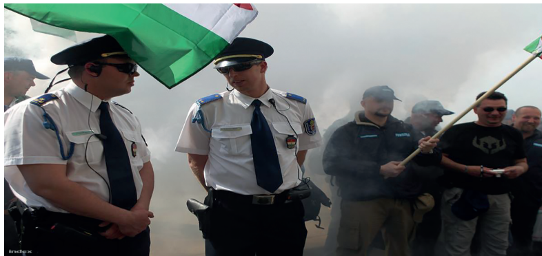
2. ábra: A rendőri képmás felhasználásával kapcsolatos eljárás során kifogásolt kép. Forrás: Dr. Schubauerné dr. Hargitai Veronika: Az alapjogi korlátozások egyes polgári jogi aspektusai, Alkotmányos alapjogi normák érvényesülése a rendőri képmás felhasználásának tükrében. 2019. december 10-ei előadásanyag

Összegzésként a BH 2018.9.248 alapján mutatta be, hogy a tüntetést biztosító rendőrök képmásának hozzájárulásuk nélkül, felismerhető módon való nyilvánosságra hozatala esetén a sajtószabadságnak a jelenkor eseményeiről, illetve a közügyekről való hiteles tájékoztatás alkotmányos jogának van primátusa a közszereplőnek nem minősülő rendőrök emberi méltóságából fakadó személyiségi jogával szemben. Annak ellenére, hogy a tételes jog nem teszi lehetővé annak megállapítását, hogy a közszereplők mellett más személyek esetében is jogszerű lehet a képmás (vagy hangfelvétel) érintett hozzájárulása nélkül történő nyilvánosságra hozatala.