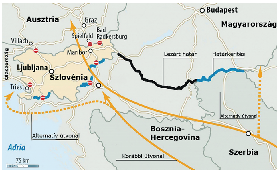
2. ábra: A szerb–magyar határon kiépített határkerítés