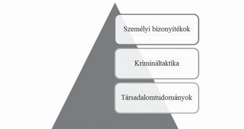
1. ábra: A személyi adatforrások fejlődésére ható tudományterületek ok-okozati összefüggésének folyamatábrája 2

Az 1. ábra egyértelműen szemlélteti, hogy a személyi bizonyítékok körét a krimináltaktikán 3 belül tárgyaljuk, és az is jól látható, hogy a taktikai jellegű bizonyításhoz nagyban hozzájárult a társadalomtudományok fejlődése. Ennek mintájára, ezzel párhuzamban a tárgyi bizonyítékok vonatkozásában ugyancsak elkészíthetünk egy piramist (2. ábra).