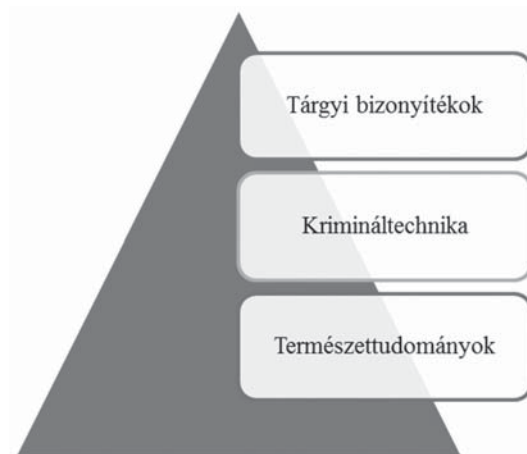
2. ábra: A tárgyi adatforrások fejlődésére ható tudományterületek ok-okozati összefüggésének folyamatábrája 4

Az 1. ábra egyértelműen szemlélteti, hogy a személyi bizonyítékok körét a krimináltaktikán 3 belül tárgyaljuk, és az is jól látható, hogy a taktikai jellegű bizonyításhoz nagyban hozzájárult a társadalomtudományok fejlődése. Ennek mintájára, ezzel párhuzamban a tárgyi bizonyítékok vonatkozásában ugyancsak elkészíthetünk egy piramist (2. ábra).