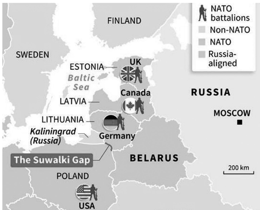
2. ábra: A Suwalki Gap, a NATO „rémálma”

Egy svájci katonai szakértő, Albert Stahel véleménye szerint folytatódik a hidegháború, mivel az immár 500 kilométer hatótávolságú Iszkanderek telepítése válaszreakció a NATO rakétavédelmi rendszerének továbbfejlesztésére. 15 Putyin elnök egy sajtókonferencián tagadta azt, hogy a telepítés megtörtént, de nem zárta ki a később történő elhelyezés lehetőségét. Közölte azt is, hogy az Iszkanderek telepítése nem az egyedüli mód, amellyel Oroszország megvédheti magát az USA által Európába telepített, de az EU által nem kontrollált rakétarendszerek ellen. 16