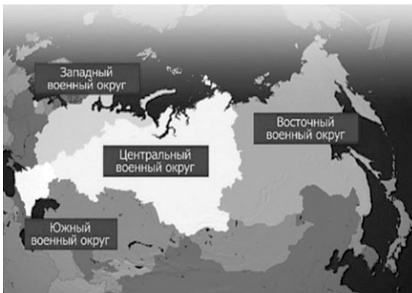
4. ábra: A körzetek az átszervezés utáni időszakban