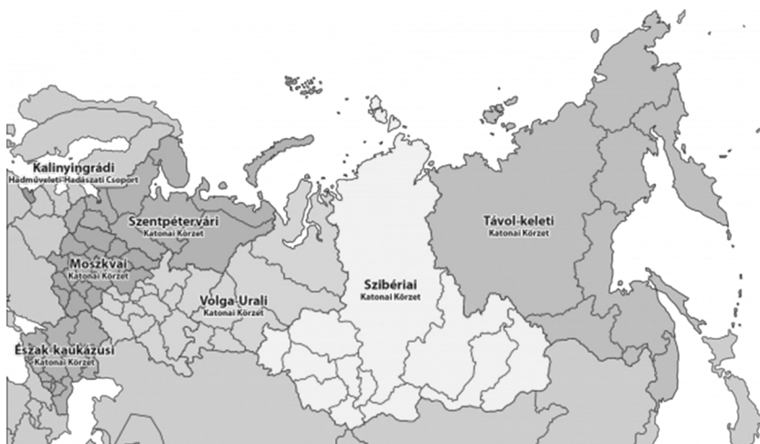
3. ábra: A katonai körzetek az átszervezés előtt

2010-ben Medvegyev elnök a hadsereg reformjának részeként aláírta azt a dokumentumot, amely a katonai körzetek számának csökkentését tette lehetővé. Az addig 6 katonai körzet nem foglalta magába a Kalinyingrádi Hadműveleti-Hadászati Csoportot, amely azonban a reform utáni időszakban a Nyugati Katonai Körzet részévé vált.