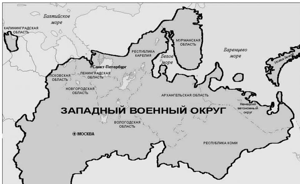
5. ábra: A Nyugati Katonai Körzet térképe

Kalinyingrád katonai vonatkozásait egy helyi német nyelvű honlap tanulmánya alapján foglalom össze, mivel nem találtam hivatalosabb jellegű (védelmi minisztériumi) összefoglalót ezzel a témával kapcsolatosan, csak egyes eseményekről (évfordulókról, gyakorlatokról) megjelent sajtóközleményeket.