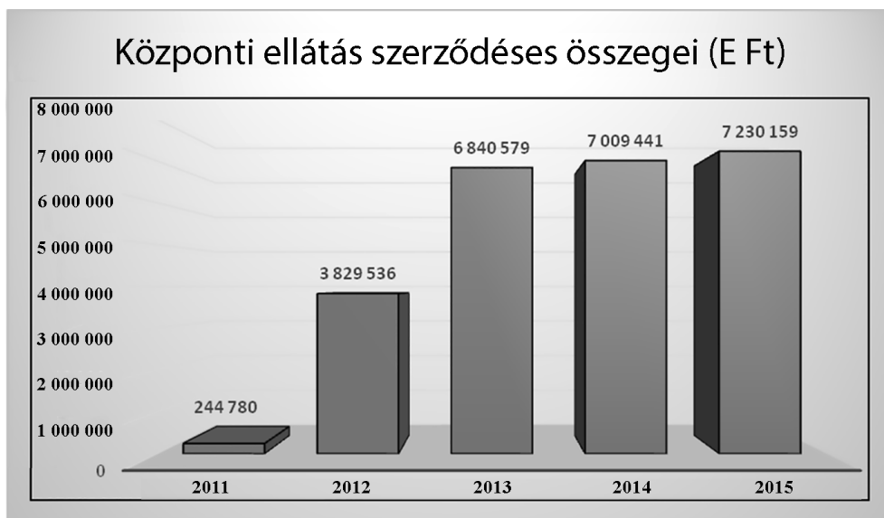
2. ábra: A központi ellátás szerződéses összegei (saját szerkesztés a BVOP Központi Ellátási Főosztály primer statisztikái alapján)

A szerződéses összegek összértéke jelentős növekedést mutat. Az első év – mivel nem teljes év – nem releváns az összehasonlításban, de a vizsgálat második és harmadik évének elemzésekor majdnem 50%-os növekedést figyelhetünk meg.