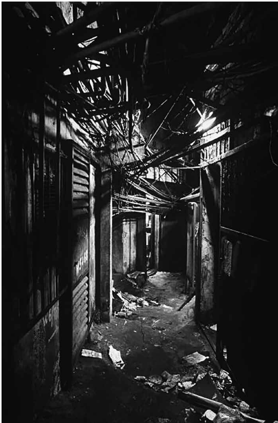
3. ábra: Mesterséges világítással felszerelt járdák.