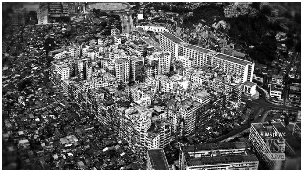
2. ábra: Kowloon madártávlatból az építési láz végén.

Viszont 1963-ban kitört az úgynevezett „építési láz”, amely során magánvállalkozók egyeztek meg a földszint vagy már létező alsóbb szintek tulajdonosaival, hogy további emeleteket húznak fel és az oda beköltöző új lakók lakbéréből közösen részesülnek. Mivel az üzlettel mindegyik fél jól járt, gombamód kezdtek kinőni a toronyházak a földből, ám ennél még jobban segíti a procedúra vizuális elképzelését az, ha egy folyamatosan növekvő tortát képzelünk el. Az építési láz az 1970-es években tetőzött, ekkor már mondhatni általánossá vált a 14 emelet magas lakóházak összefüggő látványa, amit az alábbi fotó hivatott átadni.