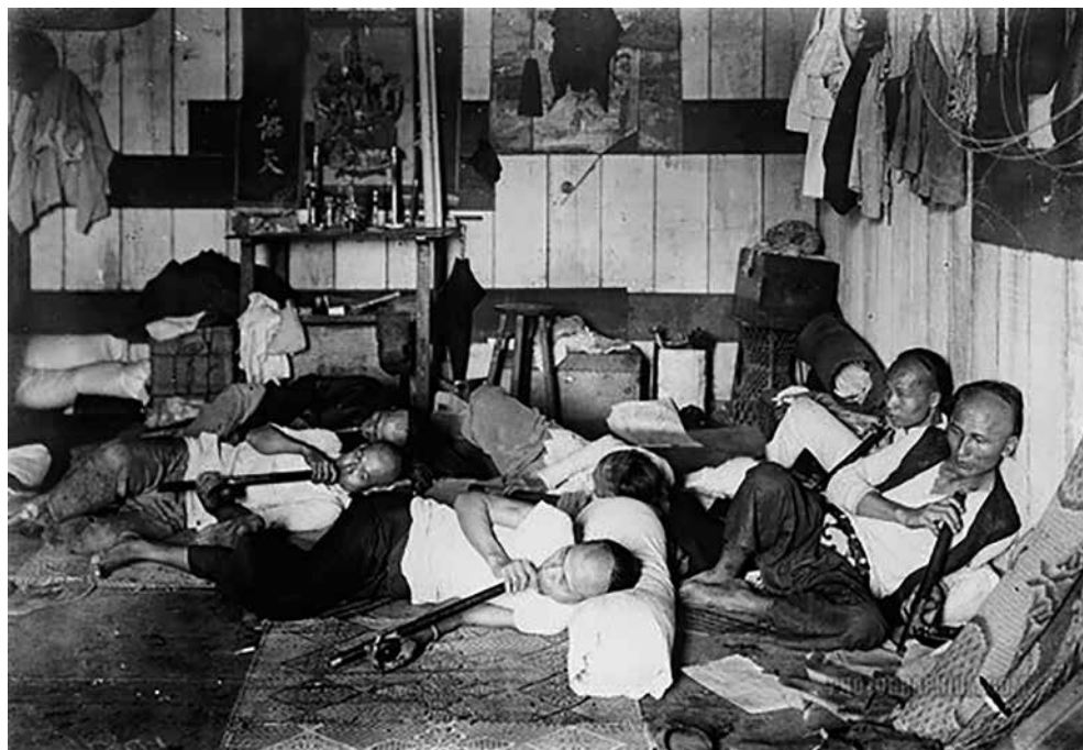
5. ábra: Ópiumbarlang az 1950-es évekből.

Az ópium Kína történelmében már kétszer is katonai konfliktushoz vezetett, az első és a második ópiumháború formájában. A Kínai Népköztársaság pedig vasszigorral lépett fel a kábítószer ellen, a jelenleg hatályos kínai büntető törvénykönyv 40 szerint is kiszabható (1000 gramm fölötti heroin esetében) a készítésért, csempészésért, szállításért és kereskedelemért a halálbüntetés. Az 1950-es években még szigorúbb szabályok, és az effektív állami fellépés miatt a triádoknak el kellett hagyniuk az anyaországot, rengetegen ide helyezték át bűnös tevékenységüket. A kábítószer-kereskedelem szempontjából előnyös a Thaiföld–Laosz–Mianmar határainak találkozásánál elhelyezkedő, „arany háromszögnek” nevezett elszeparált terület, 41 amely a legnagyobb ópiumot termelő terület volt, amíg Afganisztán meg nem előzte a rangsorban.