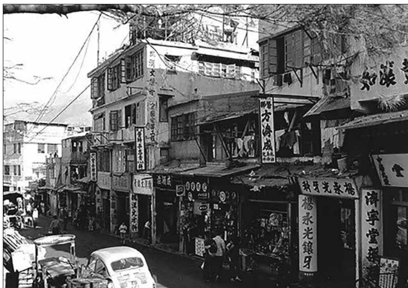
1. ábra: Utcakép az 1960-as években.

Az első kétezer menekült érkezése után folyamatosan és nagy ütemben érkeztek az új lakosok, akiknek természetesen fedél kellett a fejük fölé. Az 1950-es évek végére a földterület szinte teljesen beépült, a fennmaradt városi alaprাজzon szabad telket szinte csak nagyítással lehetett találni. Az 1960-as évekre jellemzővé váltak a 3-4 emeletes házak, de a fennmaradt képek alapján még teljesen elfogadhatónak látszanak az életkörülmények, amelyet a lenti ábra is szemléltet.